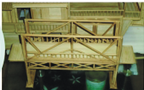
▲“造”别墅之前小试牛刀做了一座竹桥。