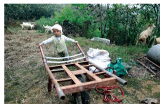
▲小孙子也来帮忙了