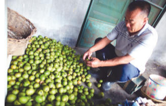
▲坐在核桃堆里剥皮