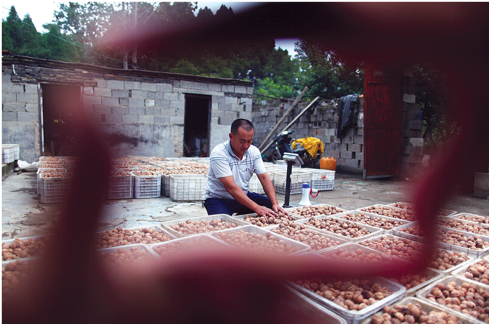
▲一筐筐准备出售的果实