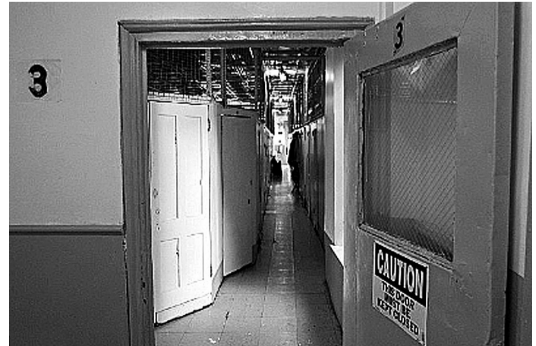
旅馆内部的走廊十分狭窄，两侧布满了没有空调的小隔间，面积不过3平方米

她指出，这对新一代的华人移民实际上是有好处的，能促进移民更好地融入美国社会。美国社会是多元化社会，在将来，完全封闭的唐人街是不可能继续存在的，更多的将是多元社区、多种族混居的情况。