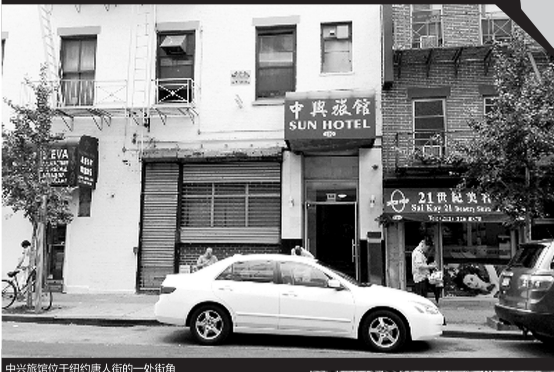
中兴旅馆位于纽约唐人街的一处街角