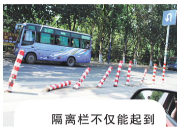
隔离栏不仅能起到