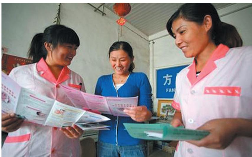
为推进流动人口计划生育管理服务工作,日前,界河镇主动为辖区内的流动人口提供计划生育政策、法规和生殖健康知识的宣传教育,深得群众的认可和赞同。