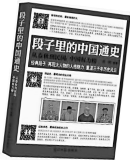
《段子里的中国通史》 光明日报出版社 2013年6月

黄一鹤，中国史深度研究者、微历史达人，先后出版过《微历史：1912-1949民国圈子》《微历史：老祖宗的人精式生存智慧》、《隋唐微历史》、《疯狂历史年表》、《官系网：古代官场人脉操纵术》、《微历史：老祖宗的人精式生存智慧》等畅销书。