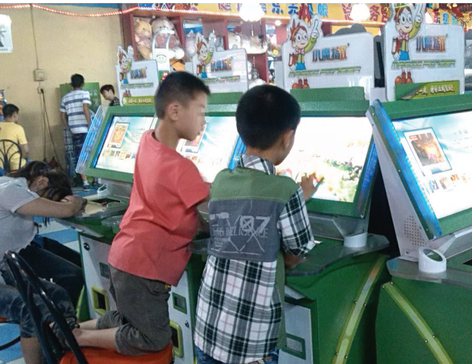
两名儿童正在电玩机前交流心得

16日下午2时左右,记者在该电玩城内转了一圈发现,偌大的电玩城内,几乎每种游戏机前都有儿童的身影。门口