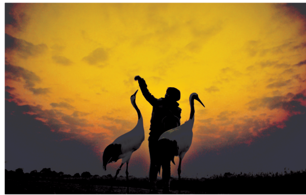
丹顶鹤姑娘