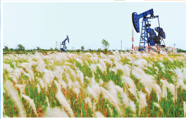
挥舞“手臂”的采油机