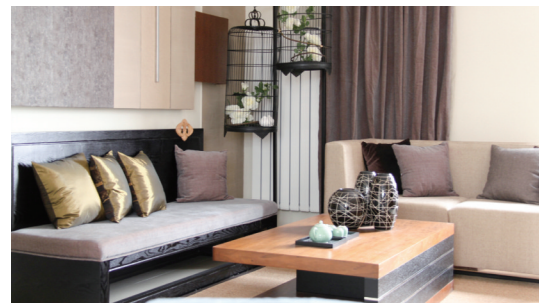
泰达地产泰达港湾公寓