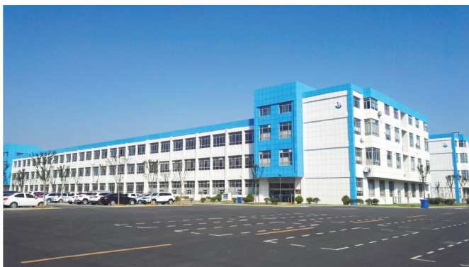
高新区新医药产业园