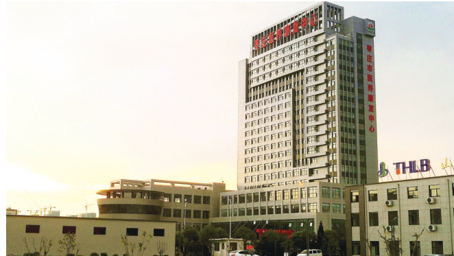
枣庄医养康复中心