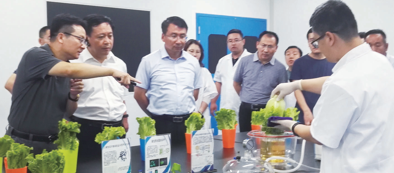
区领导到山东益华生物科技有限公司督导项目建设推进情况