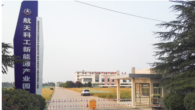
航天科工新能源产业园