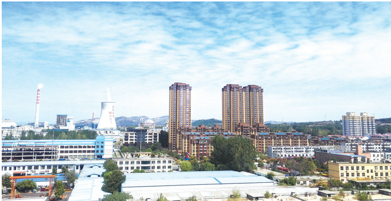
高新区重点项目聚集区