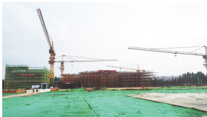
睿诺光电项目施工现场