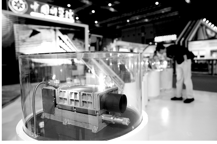
第21届中国国际工业博览会正在上海举行。在中国科学院展区,一排被放置在玻璃罩里的珍贵展品吸引了许多观众驻足观看。原来,它们就是让嫦娥四号“明眸善睐”、精准探月的“太空神器”。左图:中科院展区。右图:嫦娥四号“激光测距传感器”