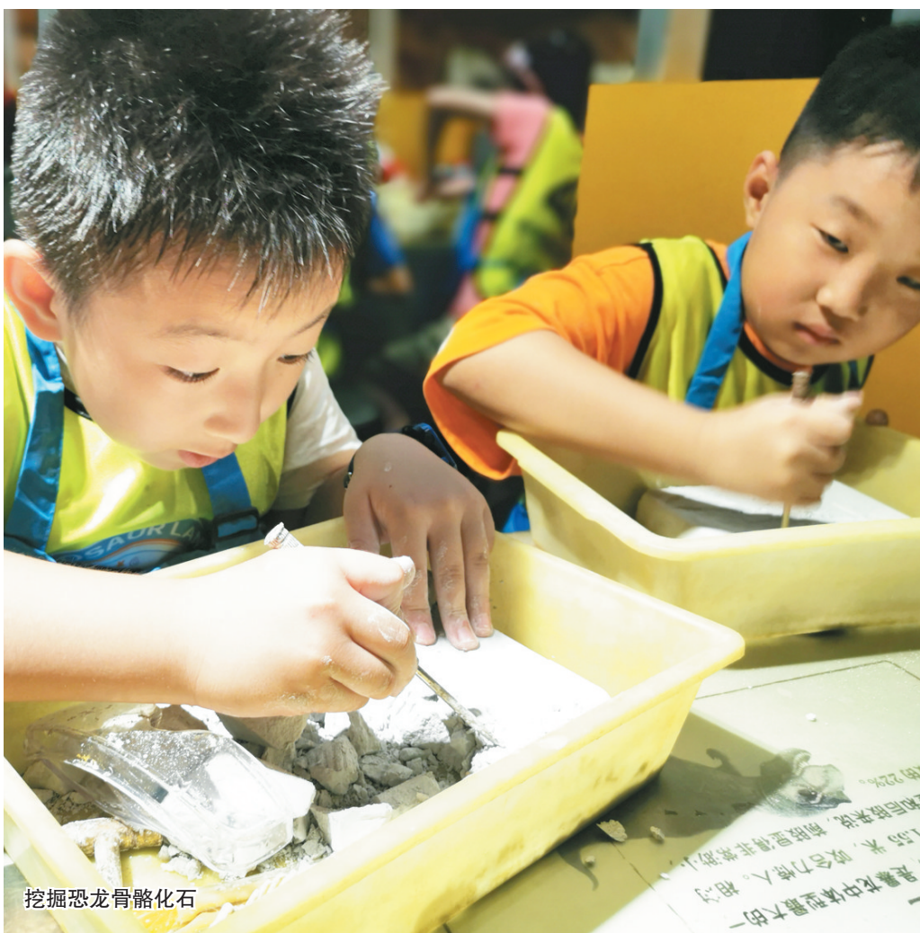
挖掘恐龙骨骼化石

特色帐篷、夜宿恐人俱乐部胶囊房、夜色下的恐龙家园等，都给小记者们带来了新鲜新奇的体验。