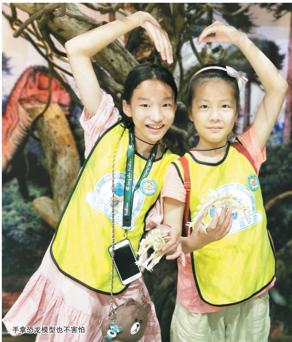
手拿恐龙模型也不害怕