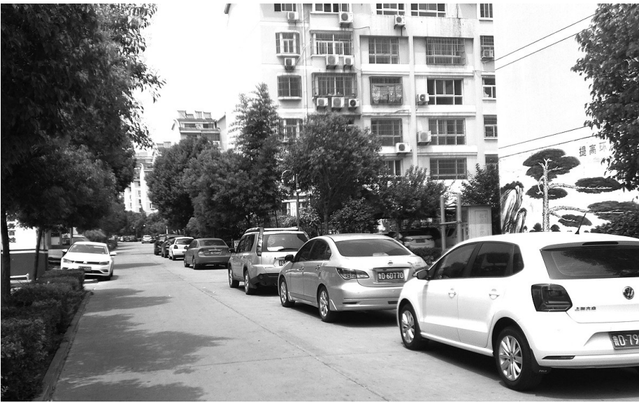
安侨国际花园一角

原来让居民不安的起因是最近4个多月内接连发生的两次火灾。居民介绍说：“今年1月3日，18号楼前面的别墅发生火灾，当时4辆消防车来了，在救火过程