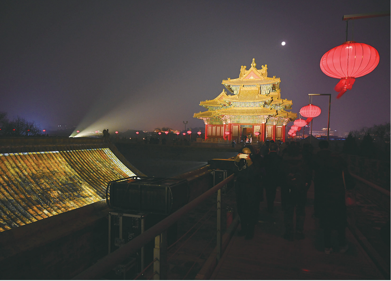
2月19日晚拍摄的故宫城墙。

作为故宫博物院“紫禁城里过大年”系列展览活动的延续，“紫禁城上元之夜”文化活动旨在满足公众的文化需求、心理需求、情感需求，更好地阐释“传统节日”这一充满团圆幸福感的话题，让新春的故宫博物院，以更加“接地气”的方式，让公众沉浸其中，感受博物馆里独特的节日味、人情味。