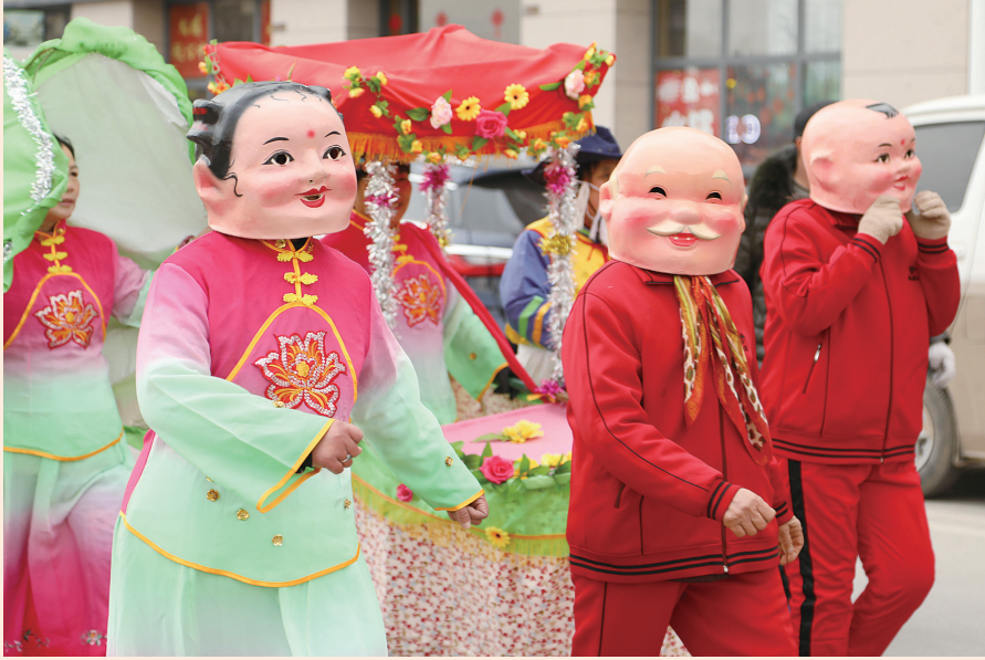
2月17日，江苏丰县中阳里街道古丰社区居民在进行民俗表演。