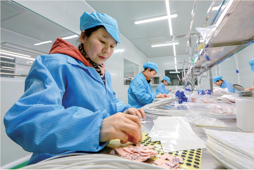
2月11日，工人在江西省峡江县工业园区一家企业的生产车间做工。

2月11日是春节假期后的第一个工作日，各行各业的劳动者纷纷投入到繁忙的生产当中。