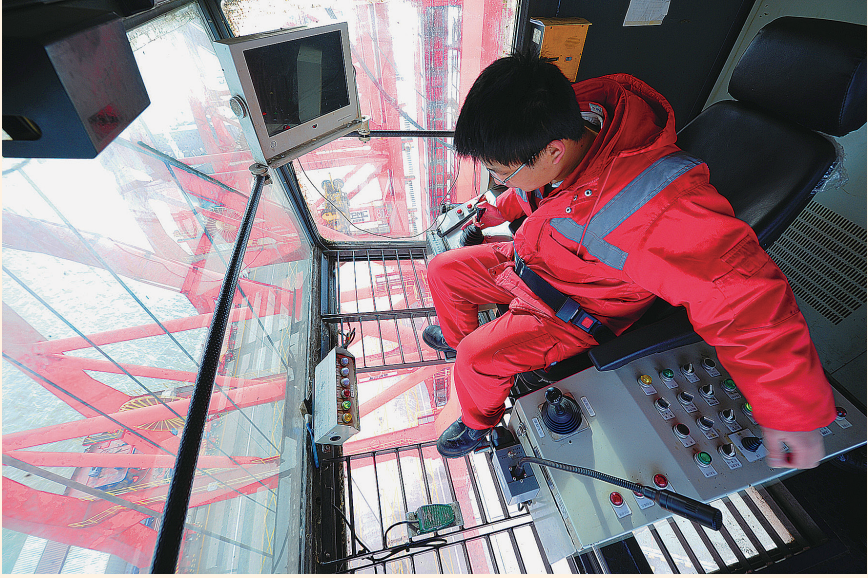
2月11日，在太仓港正和兴港码头，司机在距离地面40多米高的桥吊驾驶室吊装集装箱。