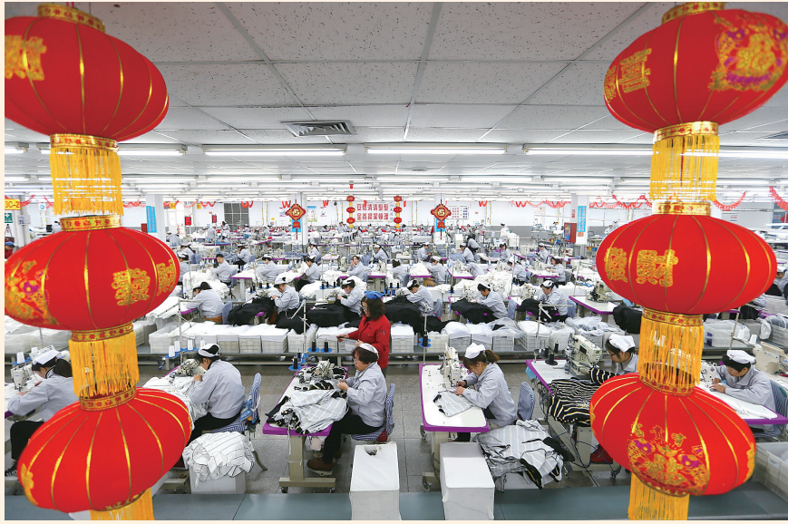
2月11日，在山东省青岛市即墨区一家大型纺织企业，缝纫工人在生产出口服装。（新华社发 梁孝鹏 摄）