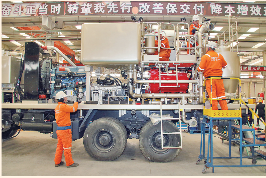
2月11日，在山东烟台一家石油装备技术有限公司，工人在制造固井车。