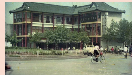
三角花园一凌云阁