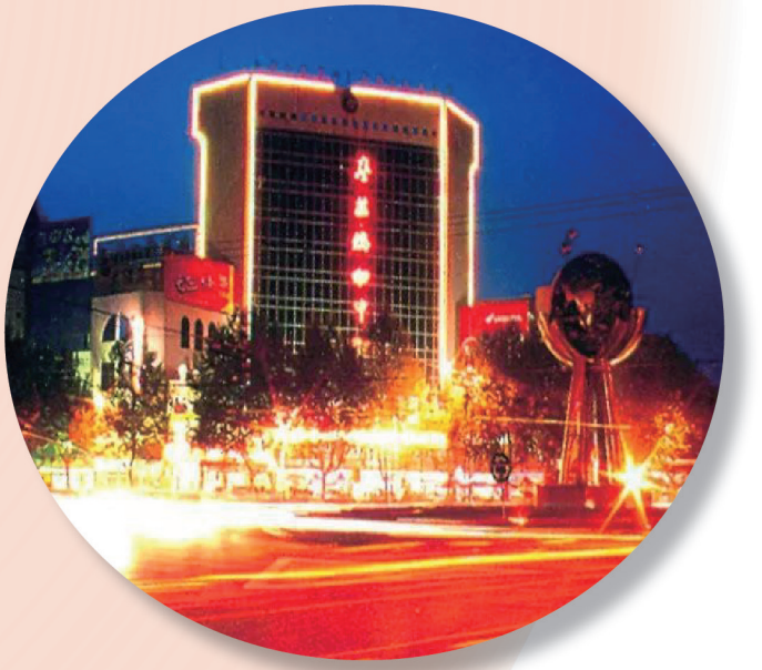
枣庄购物中心夜景