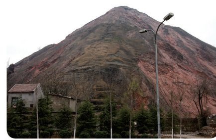
原枣庄煤矿“研石山”