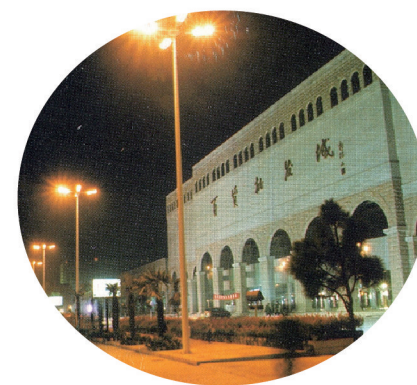
枣庄百货批发城夜景