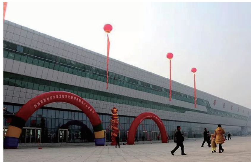
2016年1月9日投入使用的枣庄客运中心