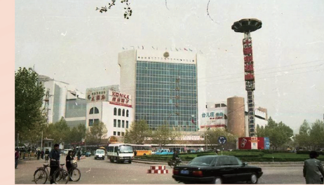
1991年9月的三角花园，高大的枣庄购物中心早已取代了凌云阁