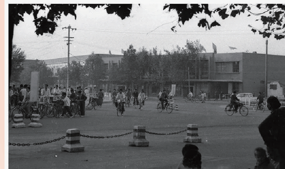
上世纪80年代的三角花园