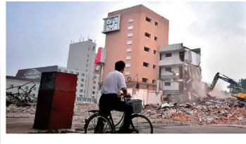
正在拆除中的三角花园汽车站