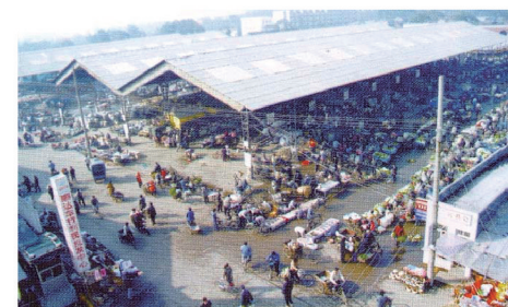
枣庄利民农副产品批