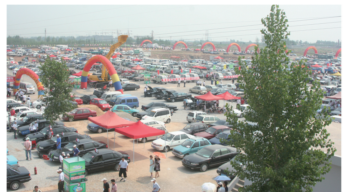
全国二手车交易示范基地现场