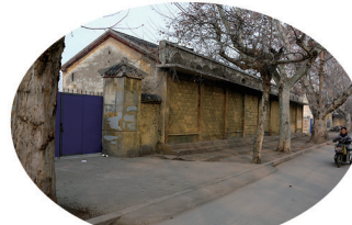
1964年至1986年12月31日使用的枣庄汽车站尚未拆除的部分建筑物，现已建设为红旗小学西校区