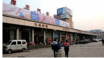
1987年1月1日至2016年1月8日使用的三角花园汽车站