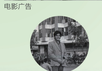
本片摄于1988年11月，背景为商业影院，后改造成枣庄大酒店