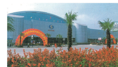
新昌批发市场外景