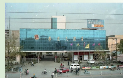
枣庄大酒店旧景。时至今日，她依然是市中的地标之一