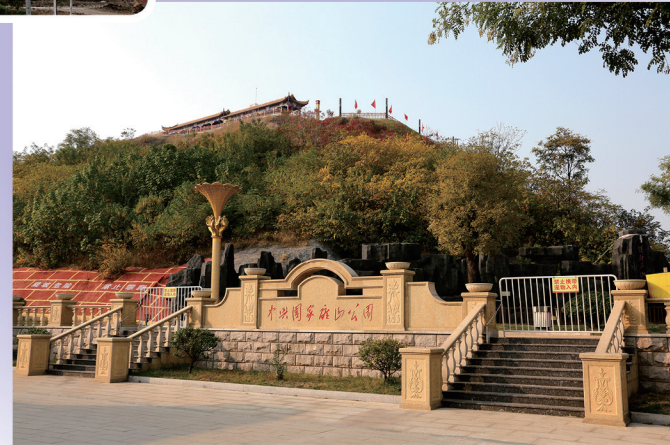
中兴国家矿山公园