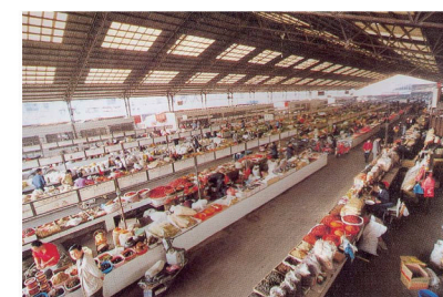
繁荣有序的龙头市场