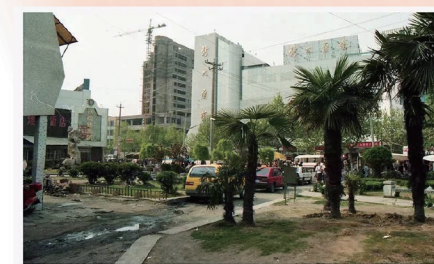
上世纪90年代的三角花园