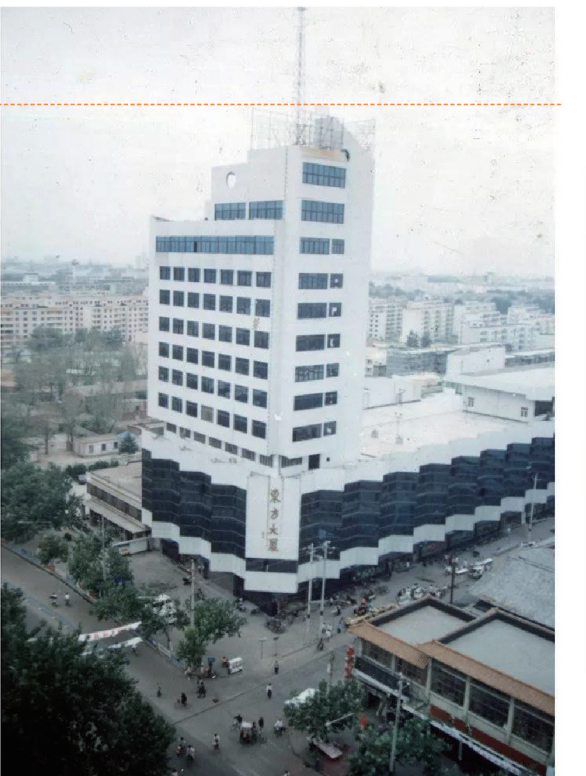
东方大厦，摄于1989年，现在是友谊服饰广场