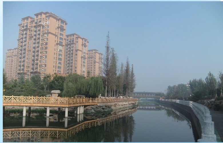
东沙河光明路北景