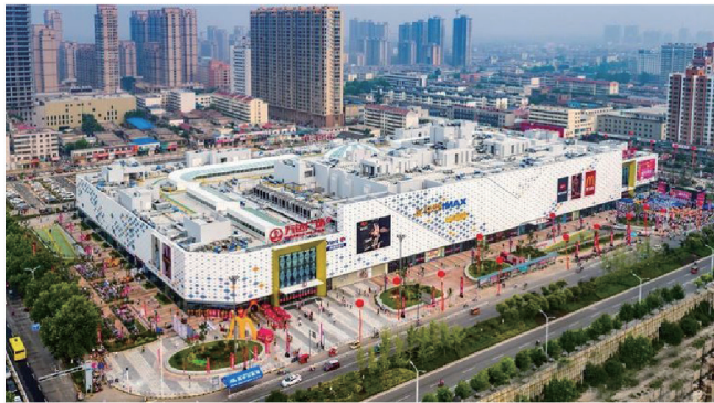
枣庄万达广场全景