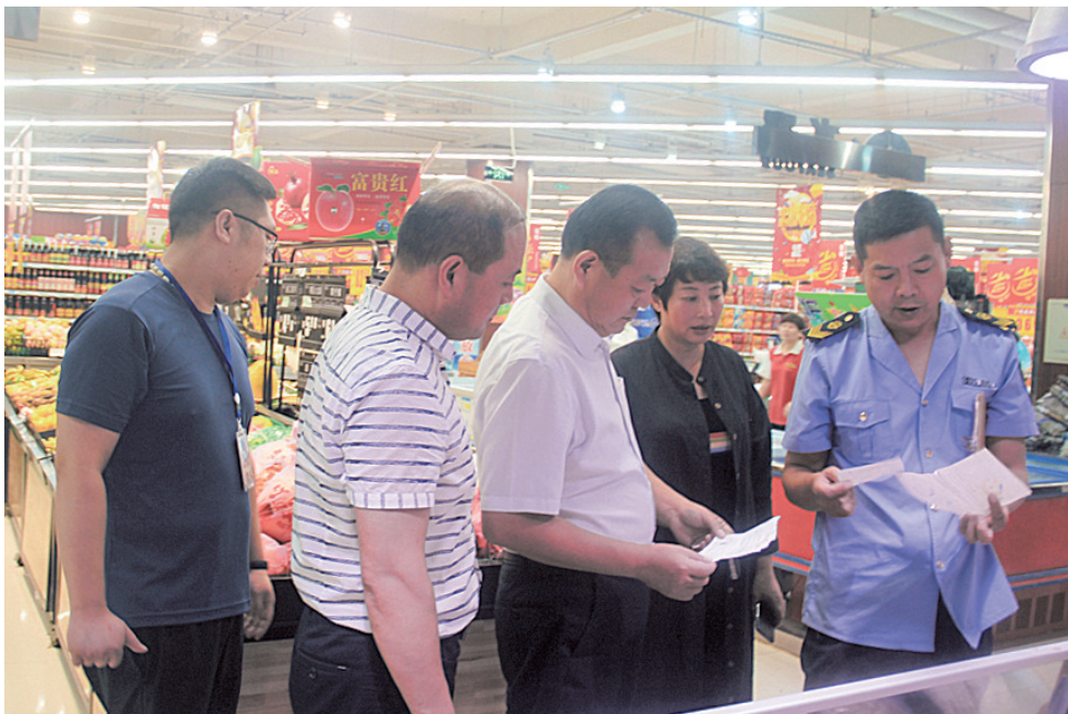
促进平安和谐建设