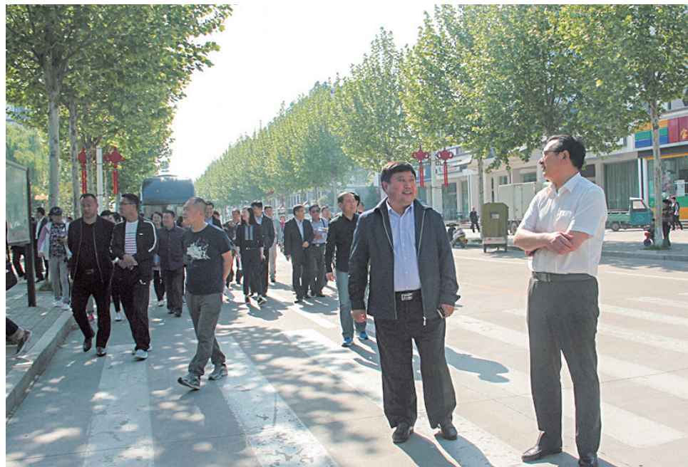
学标对标外出学习