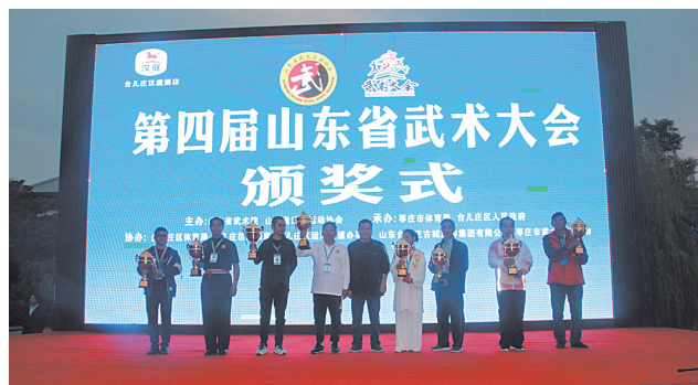
打造品牌会展项目

坚持以提升居民幸福率为目的。保障社会民生,释放发展红利,着力抓实精准扶贫,致力走好产业、金融、社会事业、政策和社会帮扶等扶贫路径,扎实做好富民生产贷、旅游扶贫等扶贫项目……今年以来共发放项目分红、教育资助、医疗报销等各类资金18万余元;截至目前新增就业700余人,报销城镇居民医疗费用500余万元。维护社会和谐稳定,深入开展法治政府、平安街道建设,着力推进扫黑除恶、雪亮工程、食品安全、安全生产等平稳开展,全街无安全事故发生,居民生命财产安全得到有效维护,营造了和谐稳定、健康有序社会发展环境。