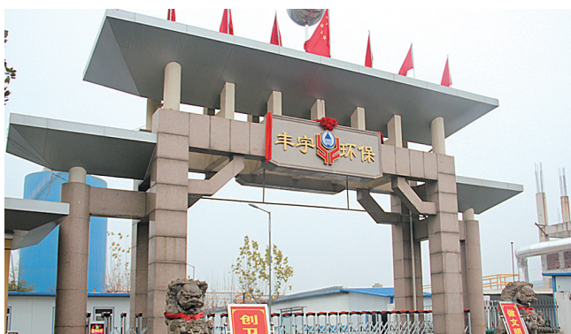
强化生态建设 提升宜居企业水平