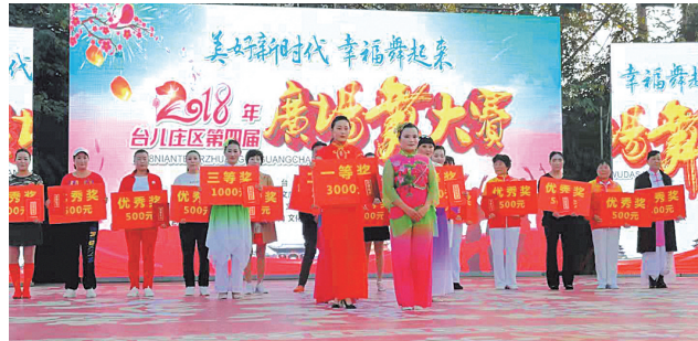
丰富多彩文体活动