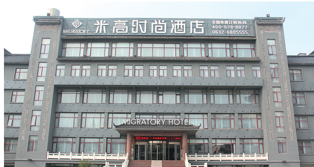
引进品牌酒店助推全域旅游