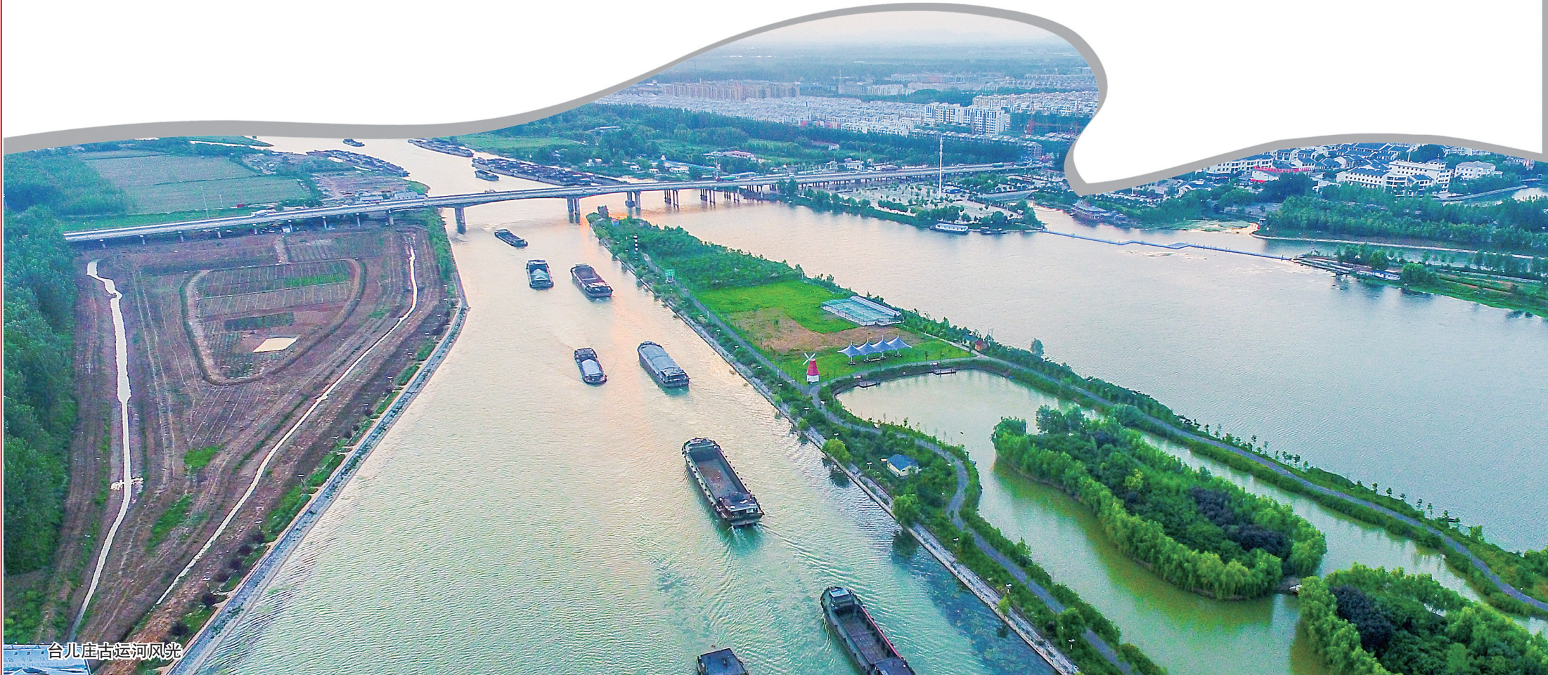
台儿庄古运河风光

自2016年2月被列入国家首批全域旅游示范区创建单位以来,台儿庄区围绕“中华运河文化传承核心区、国际知名旅游目的地、世界文化遗产”三大定位,充分发挥古城溢出效应,积极推动旅游业转型升级,走出了一条由观光游向休闲度假游转变、由古城游向全域旅游转变的发展之路。2010年来,全区累计接待游客4600万人次,旅游产业带动就业3.52万人,旅游发展各项指标再创新高,全域共建、企业共融、全民共享发展格局初步形成。2017年8月,《全域旅游“台儿庄模式”》入编国家旅游局《全域旅游大有可为》一书,成为发展典型;《台儿庄全域旅游“五全模式”成典型》被新华社《领导决策信息》配发编者按全方位宣传报道;以山东省第一名全国第三名的总成绩入选2017中国全域旅游魅力指数排行榜,旅游业已成为新旧动能转换引领台儿庄城市转型的支柱产业。