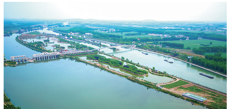
双龙湖观鸟岛全景

战略合作,央视和山东卫视多次直播报道台儿庄古城节日活动;开展山东好时节·敞开南大门·寻梦英雄地台儿庄区首届全域旅游节事活动,整体推介全年4类16项旅游节事活动。承办世界老年旅游大会、世界摄影大会、广西全域旅游专题培训等活动,通过与专业组织的沟通交流,宣传台儿庄旅游资源。