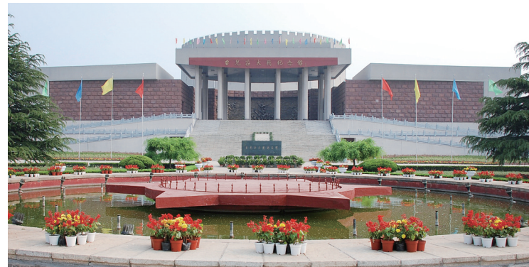
台儿庄大战纪念馆

在旅游这个核心要素的带动下,该区一二三产正在进行深度融合,逐步向“旅游+一切,一切+旅游”产业发展格局迈进。