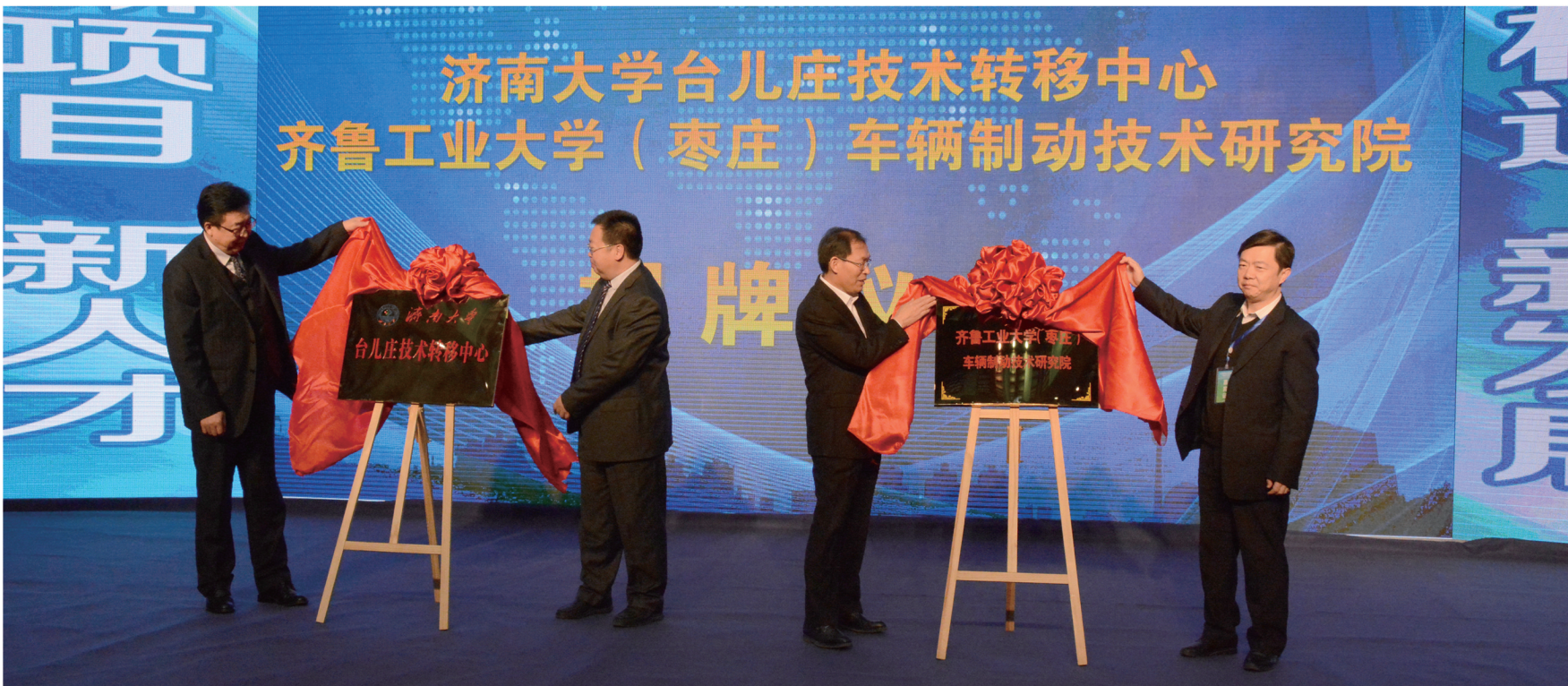
济南大学台儿庄技术转移中心和齐鲁工业大学（枣庄）车辆制动技术研究院成立揭牌