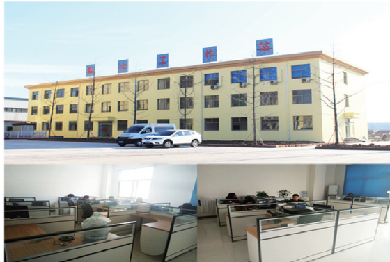
鑫金山机械建立院士工作站