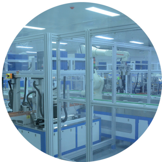
华亿比科新能源电池生产车间

今年以来，在市委、市政府的正确领导下，台儿庄区全面贯彻落实党的十九大和十九届二中、三中全会精神，以习近平新时代中国特色社会主义思想为指导，按照市委、市政府“5951”总体工作思路，紧紧围绕“1224”工作格局，坚定不移抓项目、促发展、惠民生，全区经济社会保持稳中向好的发展态势。前三季度，全区生产总值完成150.78亿元，增长4.6%；一般公共预算收入完成6.24亿元，增长3.3%；税收收入实现8.06亿元，增长30.4%；规上工业增加值增长7.9%、工业技改投资增长5.2%，增幅居全市首位；工业用电量4.6亿度，同比增长7.7%。