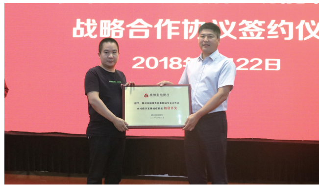
举行乡村振兴暨银企战略合作签约仪式

使命重在担当,实干铸就辉煌。站在新时代的起点上,滕州农商银行将紧紧围绕市委、市政府重大决策部署,以敢为人先的闯劲、百折不挠的韧劲和持之以恒的钻劲,开拓新思路、拿出新举措、开辟新道路,推动改革发展再上新台阶。