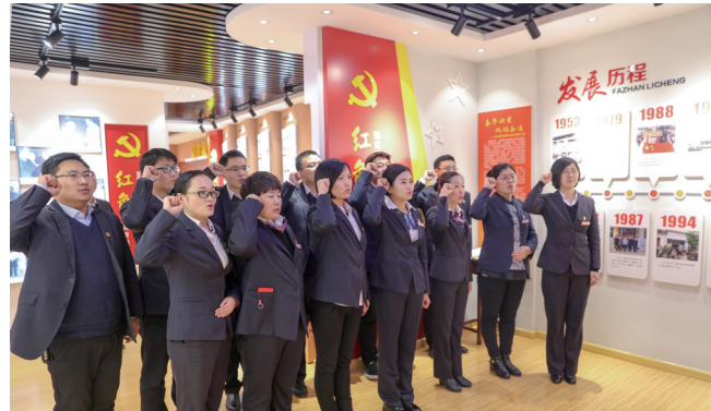
开展重温入党誓词活动