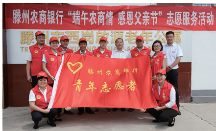
到老年公寓开展青年志愿服务