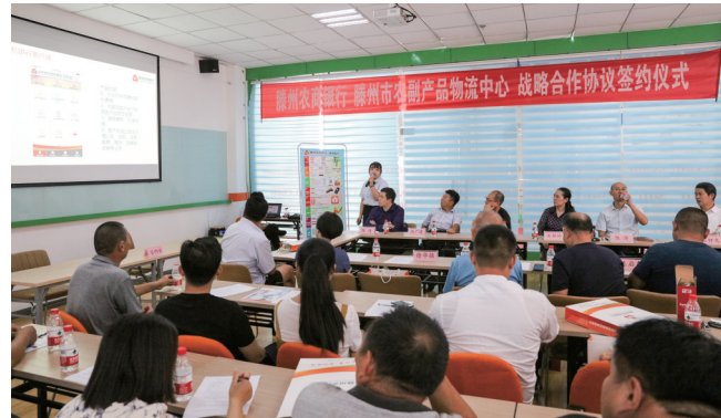
和农副产品物流企业进行战略合作