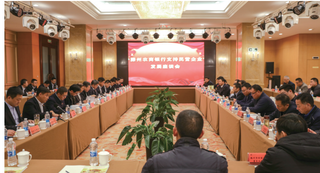
召开支持民营企业发展座谈会