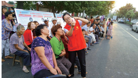
举行金融知识下乡活动

近年来,滕州农商银行全面贯彻落实党的十九大精神,围绕省联社党委“123456”总体工作思路,坚持以党的建设为统领,坚守服务“三农”和实体经济的经营宗旨,按照市委、市政府的工作部署和地方经济发展大局,积极践行“富农兴商,善行致远”的文化理念,不断深化改革,加快转型发展,提升服务水平,努力打造市民喜爱的普惠银行。截至目前,各项存款余额177.49亿,较年初增加5.25亿元,各项贷款余额120.41亿元,较年初增加14.21亿元,累计支持农户30128户,支持中小企业657家。