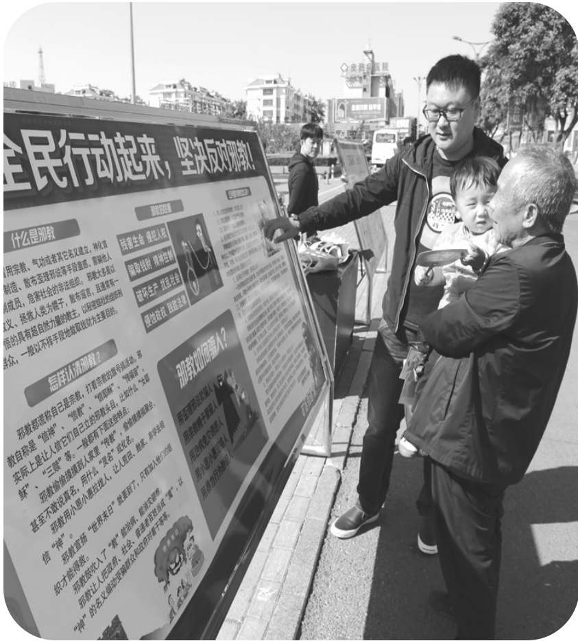
市中区组织11个镇街在光明广场开展“崇尚科学 反对邪教”为主题的警示教育宣传活动

市中区从维护社会稳定、构建和谐社会大局出发，高度重视“反邪教”警示教育宣传工作，创新了“三级联动、动静结合、点面开花”的宣传模式，牢牢把握警示教育宣传工作的主动权，占领意识形态工作的制高点，通过丰富多彩的宣传活动，在全社会形成“崇尚科学、反对邪教、关心家庭、珍爱生命”的良好氛围，进一步提高全民识邪、拒邪、反邪的意识，在全区掀起“反邪教”高潮。