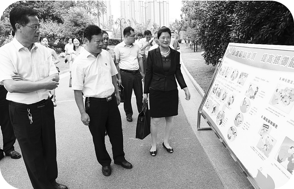
市、区领导在市中区“反邪教”警示教育宣传月启动仪式现场