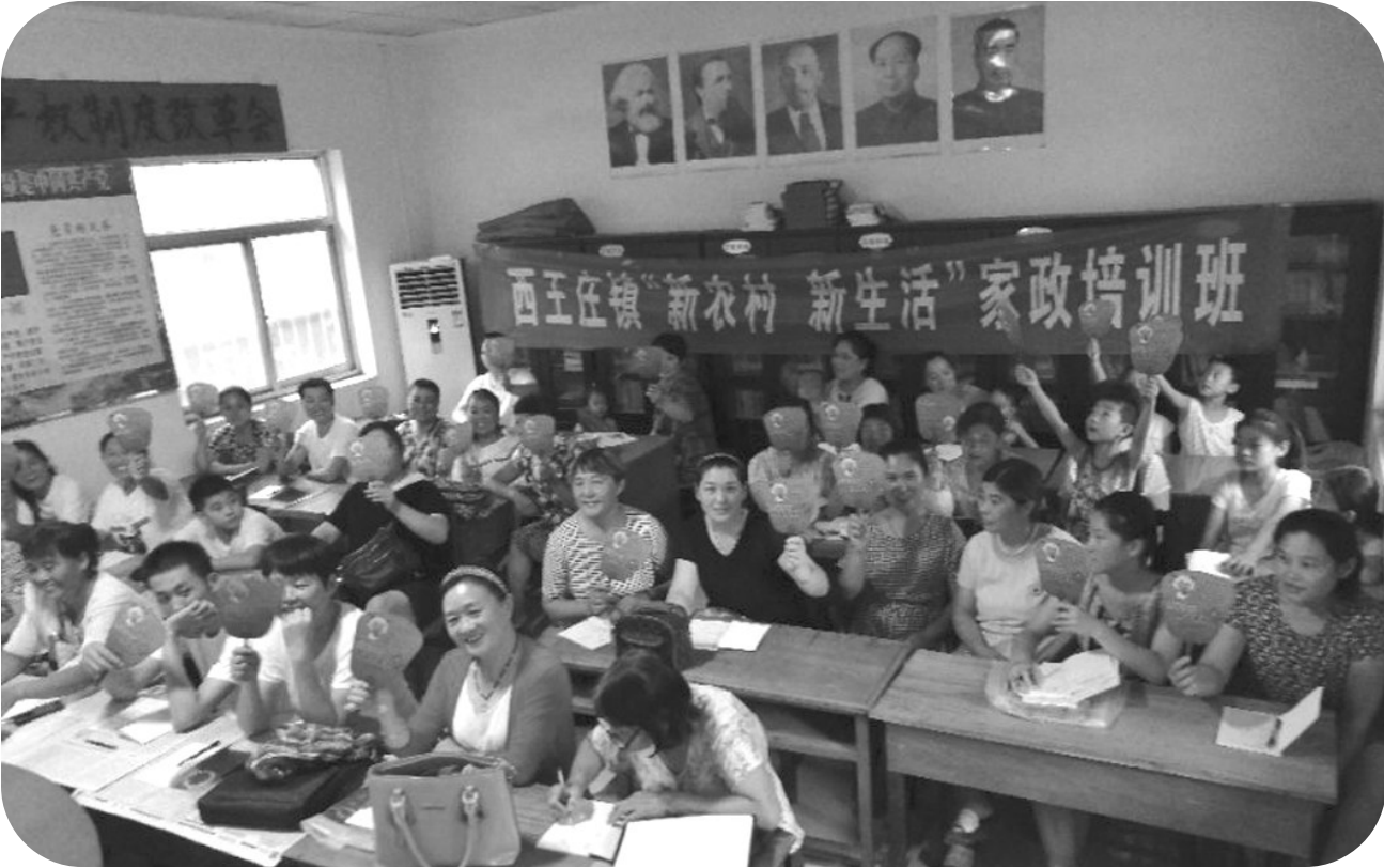
西王庄举办“反邪教”知识进家政培训班