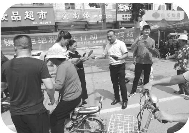
孟庄镇反邪教宣传志愿者向过往群众发放“反邪教”宣传扇，讲解“反邪教”宣传知识

广而告之之媒体发声。 市中区积极打造立体宣传阵地，高度重视传统媒体和新媒体的融合，枣庄日报、市中新报、市中区广播电视台、市新闻网站多次发表、播放“反邪教”科普知识和“反邪教”宣传报道，扩大了宣传覆盖面，提高了知晓率，增强了社会反邪氛围。微信公众号“幸福微市中”、各镇街、学校利用美篇等APP发布图文并茂的“反邪教”科普知识，充分发挥了微信开放、快捷、互动的功能特点，借助微信平台开展“反邪教”宣传工作与手机微信用户拉近了距离，打造了指尖上的宣传阵地，积极拓宽了网络“反邪教”宣传渠道，使宣传的形式从“面对面”增加到了“键对键”。这种亲民而不扰民的宣传方式将主动权交给受众，微民可以进行反馈和评价，获取知识的同时也可以提出自己的意见，使“反邪教”知识得到了广泛宣传，获得了社会各界广泛好评。