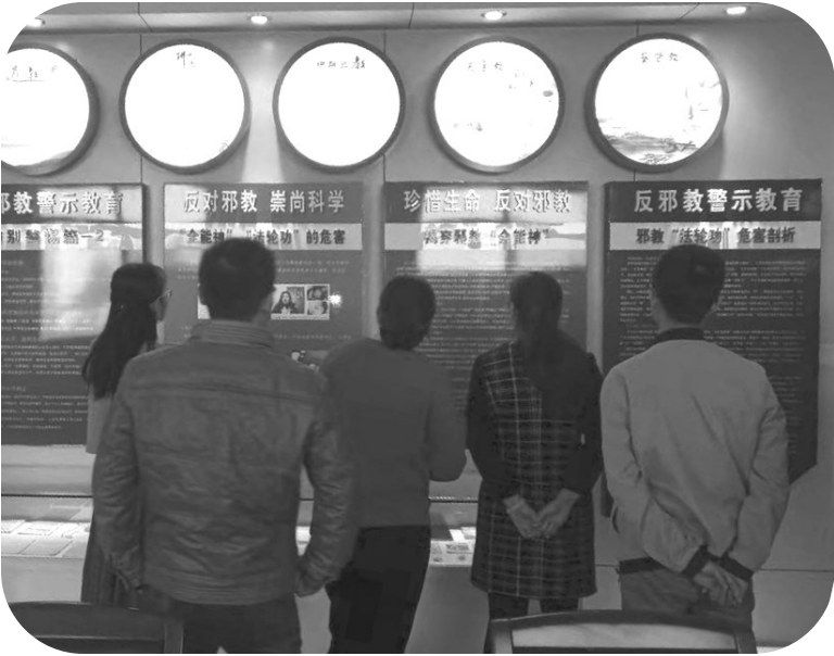
永安镇兴安彩印“反邪教”警示教育基地