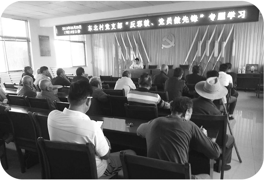
税郭镇在东北村党支部开展“反邪教”主题教育活动

拨云见日之专家宣讲。 为进一步提高全区“反邪教”干部队伍的整体素质，夯实“反邪教”工作的基层基础，充分发挥基层党组织的群防群治作用，推动全区“反邪教”工作有序开展，市中区先后组织区直部门主要负责人、各镇街、“反邪教”成员单位工作骨干，区直各学校校长及有关单位开展“反邪教”骨干培训。邀请全省“反邪教”宣讲专家围绕“什么是邪教”“邪教与宗教的区别”“邪教的欺骗手段和危害”“如何防范邪教”等方面进行了专题宣讲活动，使学员们更清楚认识到邪教组织的本质，掌握了“反邪教”宣传工作的重点，加深了对做好“反邪教”宣传工作的认识，真正做到带着问题来学习，学会实战经验去工作。