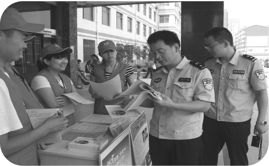
文化路街道在市立医院开展“反邪教”警示教育宣传

市中区从维护社会稳定、构建和谐社会大局出发，高度重视“反邪教”警示教育宣传工作，创新了“三级联动、动静结合、点面开花”的宣传模式，牢牢把握警示教育宣传工作的主动权，占领意识形态工作的制高点，通过丰富多彩的宣传活动，在全社会形成“崇尚科学、反对邪教、关心家庭、珍爱生命”的良好氛围，进一步提高全民识邪、拒邪、反邪的意识，在全区掀起“反邪教”高潮。