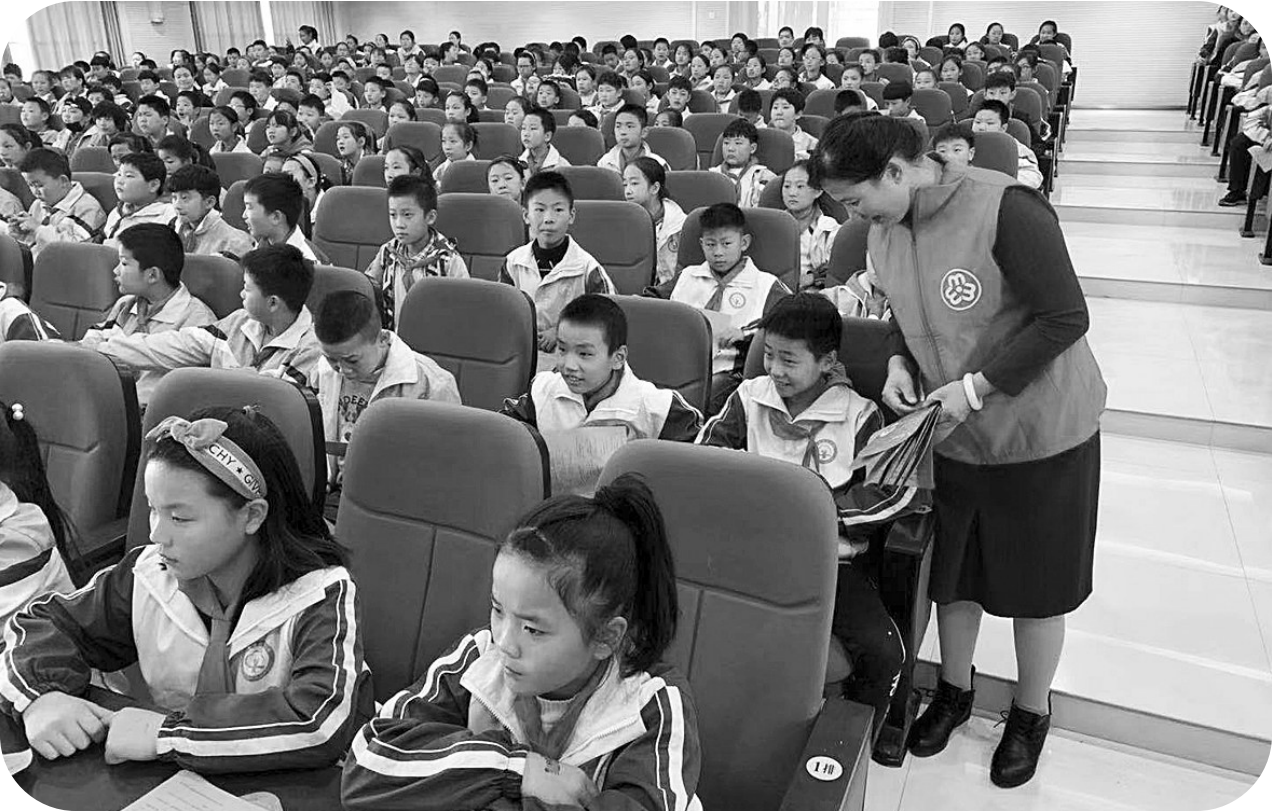
塔塔埠街道联合逸夫小学在多媒体教室开展“崇尚科学 反对邪教”宣讲活动，参加活动的师生共计400余人