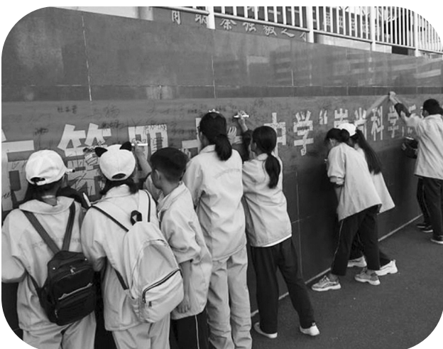
市四十一中学生在“崇尚科学 反对邪教”横幅签名