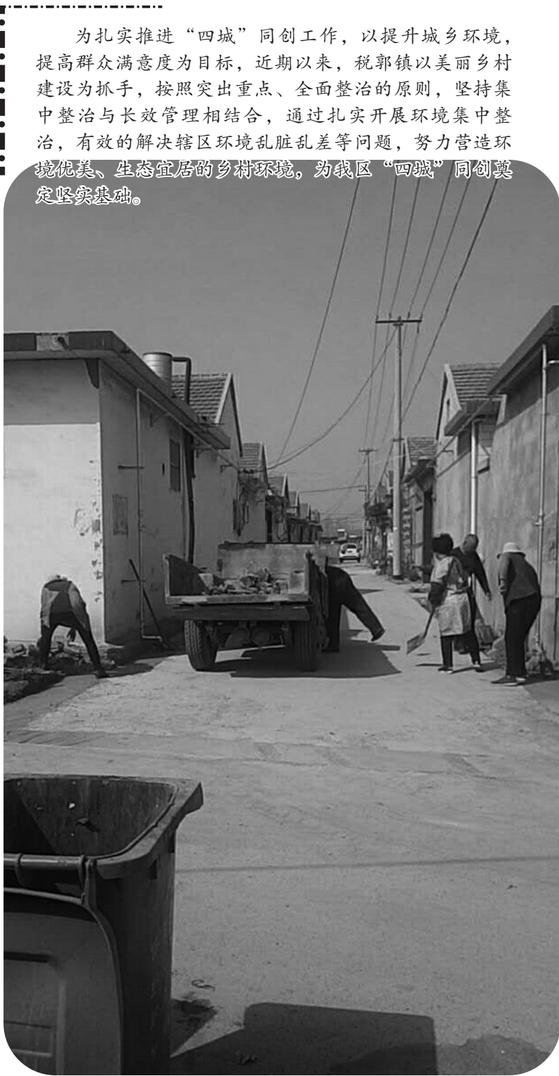
村民积极参与创城活动