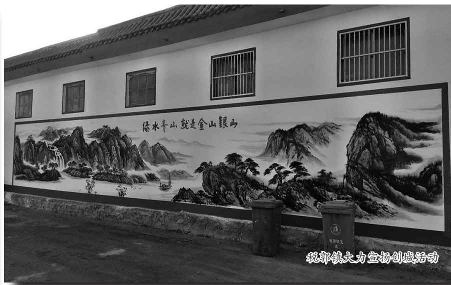
税郭镇大力创城活动