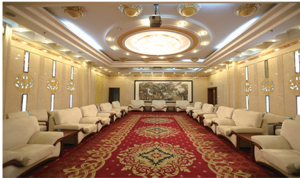
环境优美的接待室