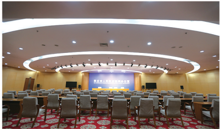
设备齐全的国际会议厅