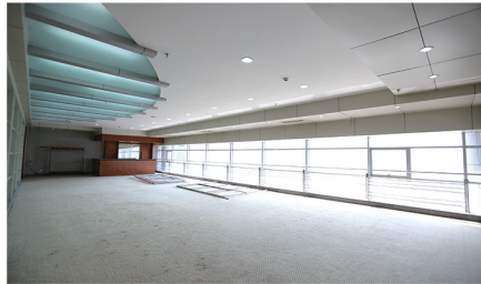
宽敞明亮的展览区