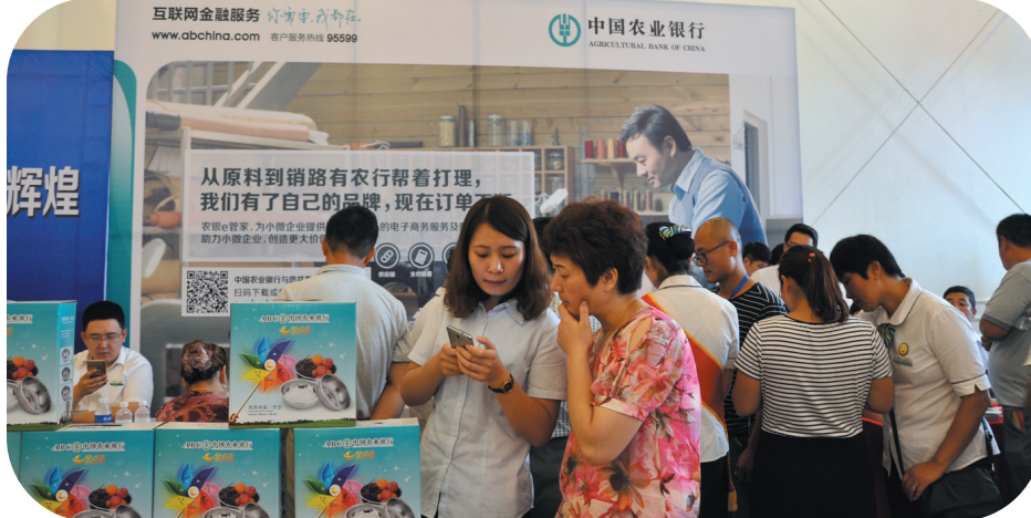
在订货会现场营销惠农e商业务