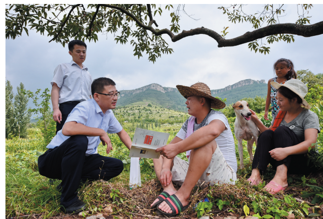
走进田间地头向农户普及金融知识