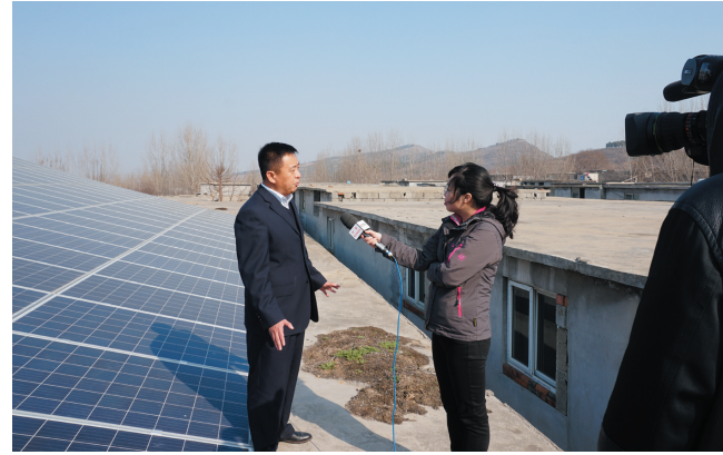
中央电视台记者采访农行光伏扶贫情况