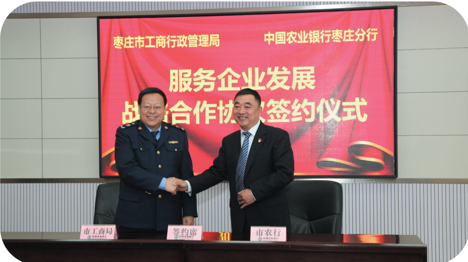
与枣庄市工商局签订战略合作协议