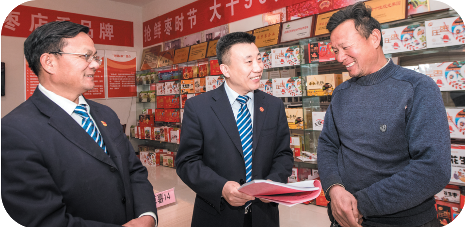
客户经理向花生产品销售商介绍农行业务