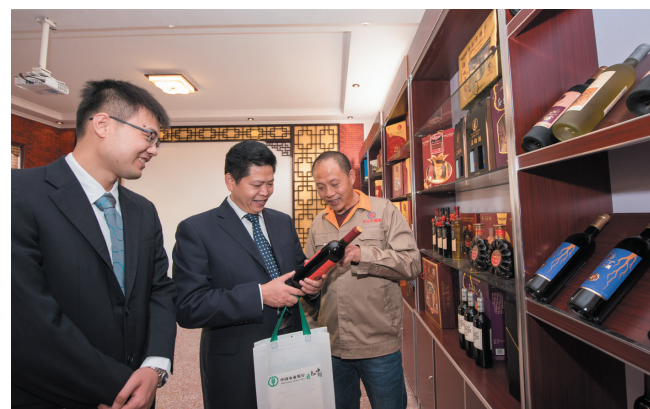
客户经理走进支持的石榴深加工(石榴酒)企业了解销售情况