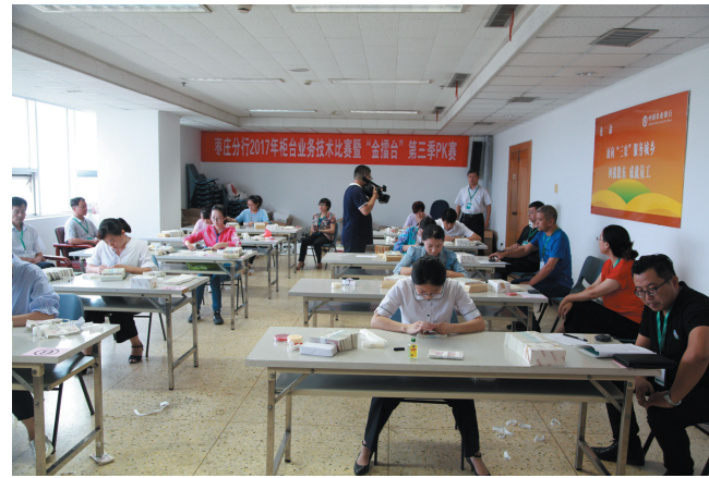
举办柜台业务技术比赛