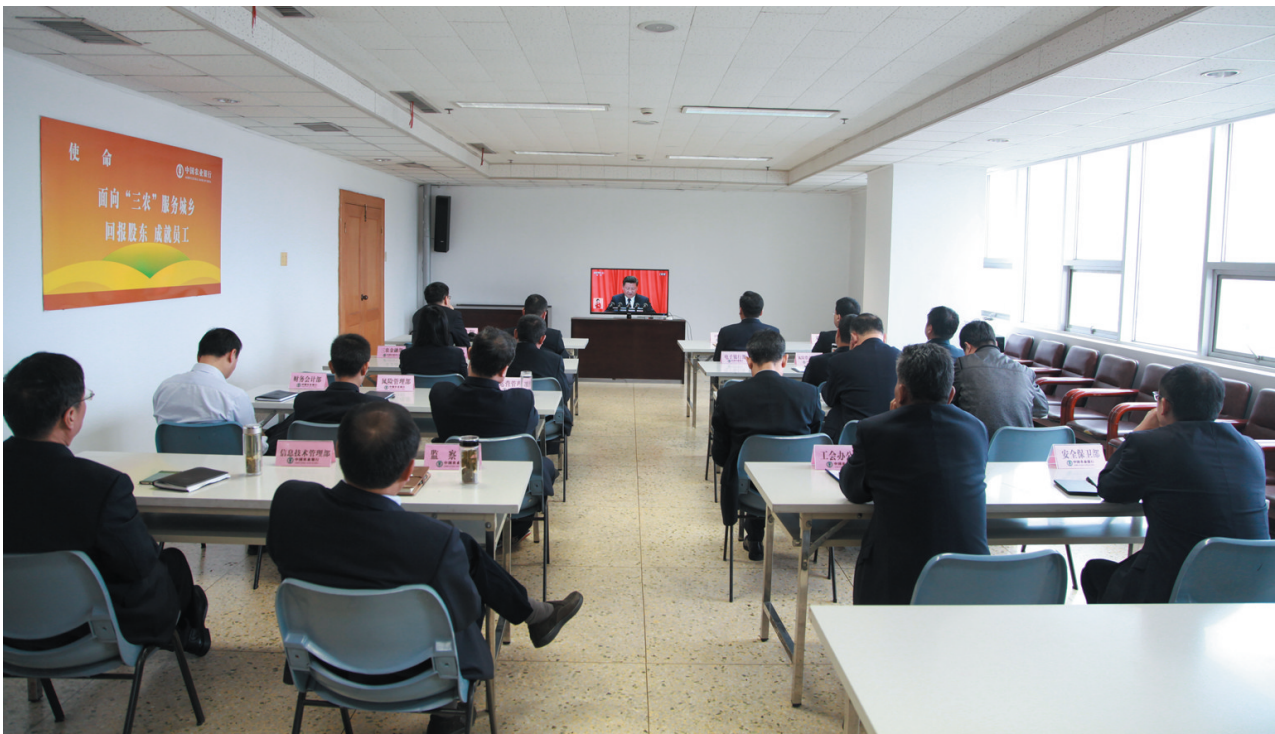
集体观看党的十九大开幕

2017年,面对复杂严峻的形势和日趋激烈的竞争态势,中国农业银行股份有限公司枣庄分行围绕“打造员工满意银行、客户满意银行”目标,继续坚持“抓班子、带队伍、做表率、强基础、控风险、稳发展”的十八字工作方针,强化“看齐意识、大局意识、发展意识、控险意识、竞争意识、创新意识”六个意识,把握稳中求进总基调,攻坚克难,砥砺前行,各项经营管理工作取得良好成效。截至2017年末,核心存款日均增量29.98亿元,同比多增11.49亿元,创历史最好水平,贷款新增10亿元,居四行前列,全行市场竞争力、价值创造力和风险控制力不断提高。