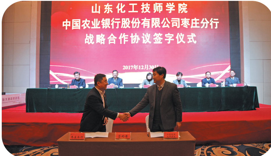
与山东化工技师学院签订战略合作协议