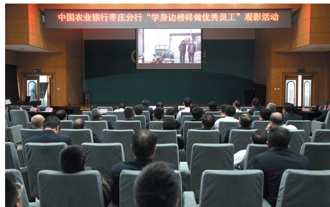
学身边榜样做优秀员工观影活动