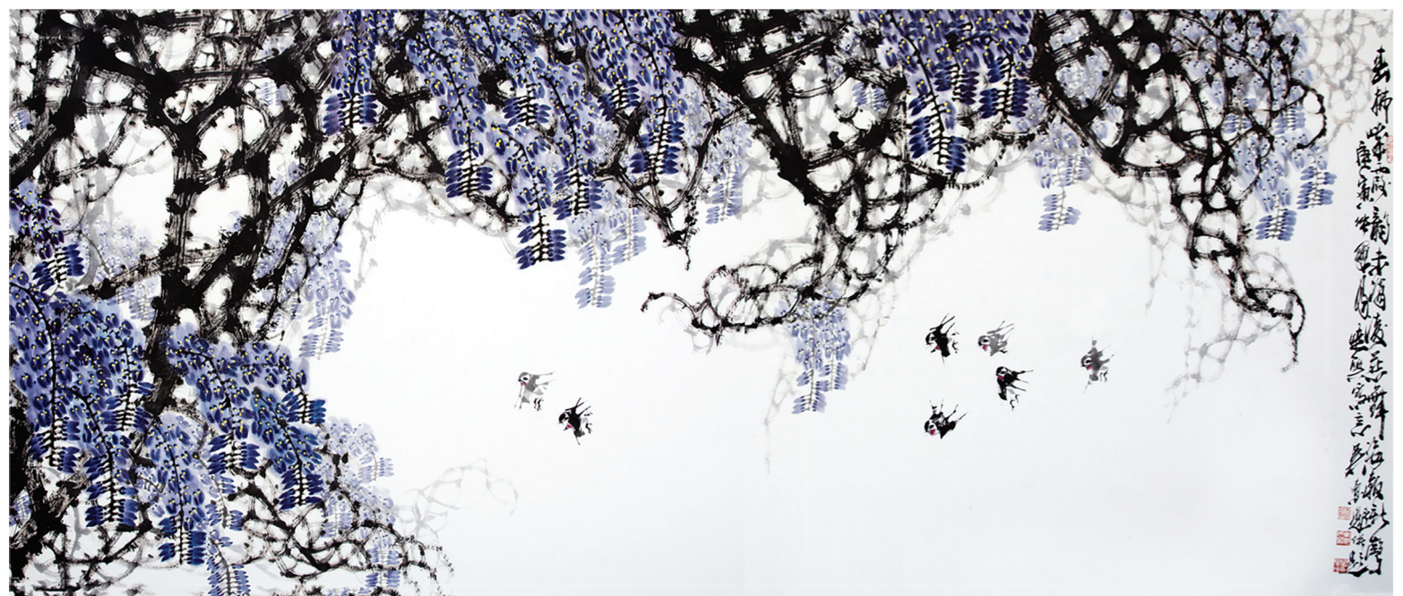
春拂紫霞韵未消 凌燕舞姿报新声