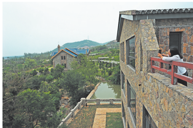
乡村爱情主题公园主打热播电视剧《乡村爱情》和著名编剧张继伟,总投资达5亿元。