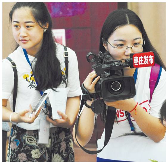
移动新兴媒体“枣庄发布”记者现场采访