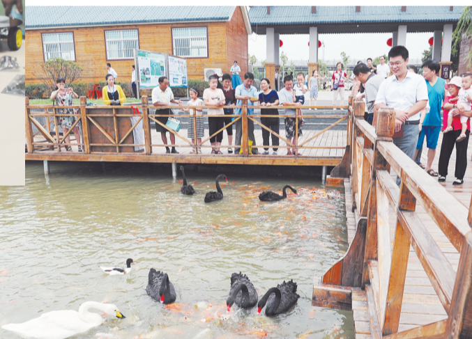
市民游览台儿庄双龙湖观鸟园