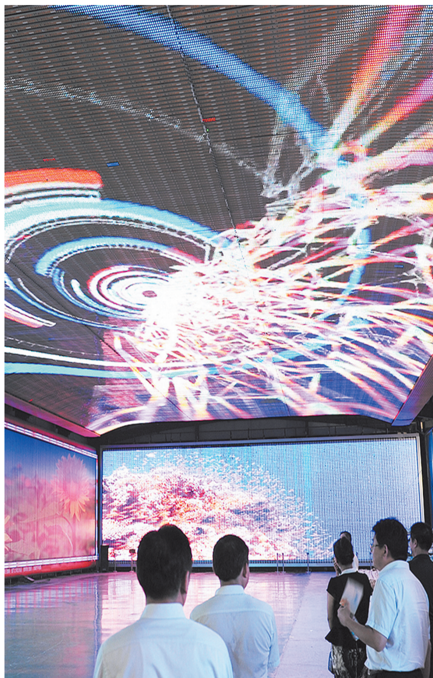
洪海光电集团强化文化创意和技术创新融合发展