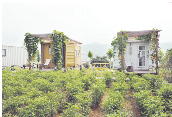
拥有“柜族”客房的石嘴子村综合旅游度假区