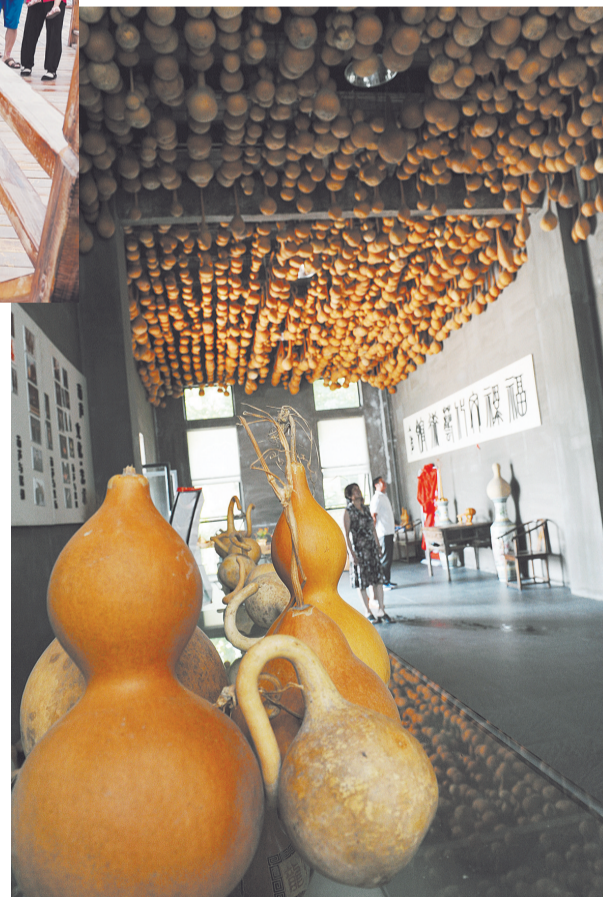
聚艺谷按照同济大学“中心城区副中心、新型产业集聚区、城市转型示范基地”的规划定位,全力打造“创意之谷、活力高地、青春之城”。