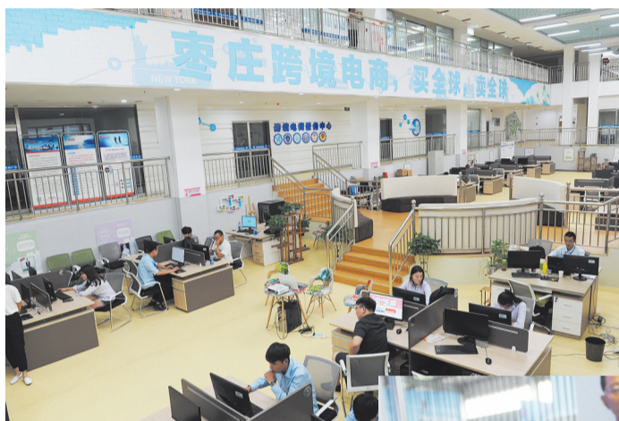
互联网小镇中的“培训——陪练——孵化”一体化跨境电商