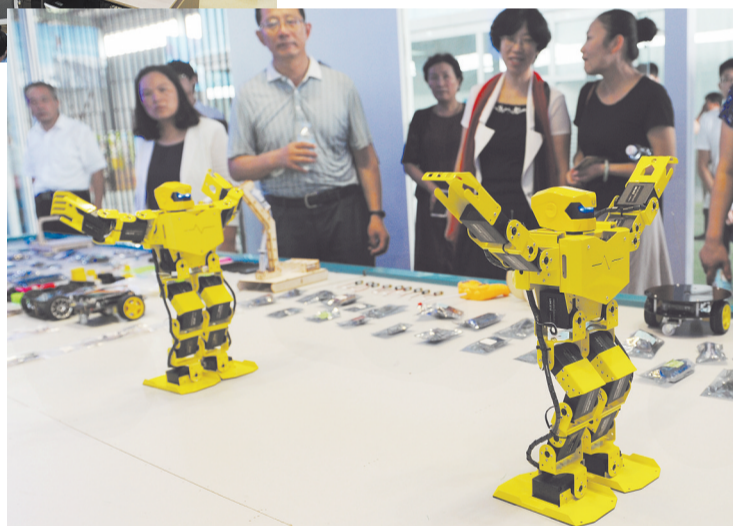
集创新DIY、创意设计与教育文化相融合的千水星动漫