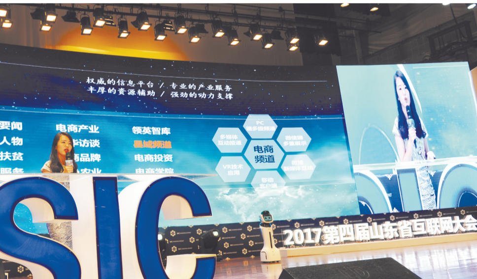
在新城会展中心举办的山东省互联网大会