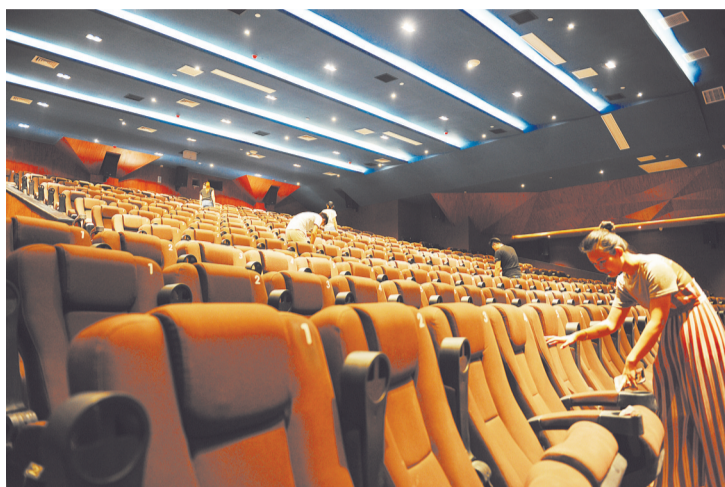
←总投资5.39亿元,建筑面积13.5万平方米的天穹影视基地是集影视制作、艺术培训、艺人经纪、文化传播等于一体的文化产业基地。

我市不断深入推进文化与经济融合发展,大力发展文化旅游、创意设计、新兴媒体、节庆会展、影视娱乐、工艺美术等产业,出台了《关于加快文化经济融合发展推动新旧动能转换的实施意见》,明确了到2020年把文化产业发展成我市国民经济支柱性产业的总体目标。努力变文化资源为文化资本,变存量优势为增量优势,变产业优势为发展优势,增强新旧动能转换新动力。截至6月份,142个500万元以上文化产业项目,今年累计完成投资同比增长28.1%,居全省第四位;36个亿元以上文化产业项目,今年累计完成投资同比增长58.4%,居全省第二位,显示了我市文化产业发展的强劲势头。