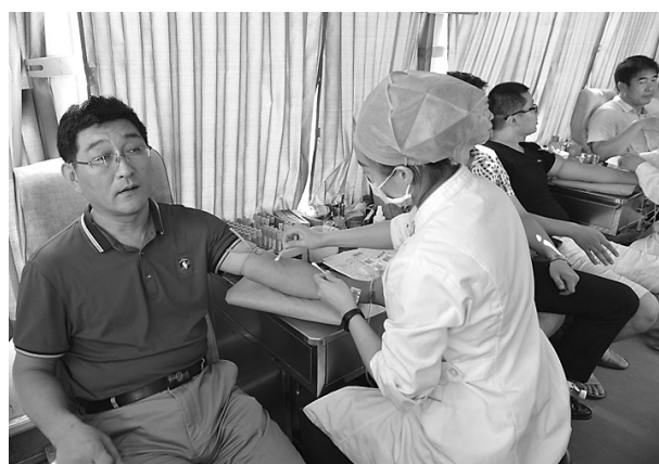
8月11日上午,薛城区人民法院组织15名干警参加无偿献血活动,此次活动共献血4800ml,以实际行动为社会公益事业奉献爱心。