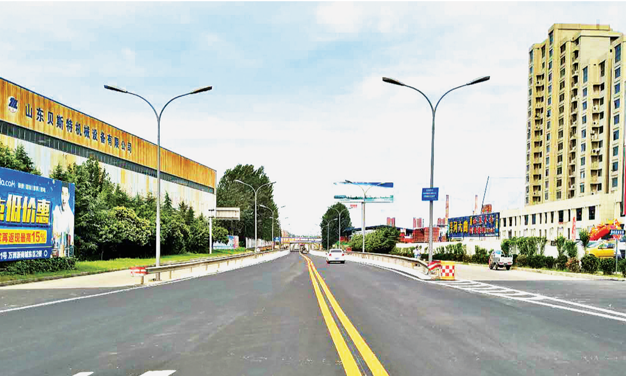
近日,薛城区薛西路(永福路—疏港路)升级改造工程施工后全面通车。改造后的路面全长约1.2公里,宽24米,宽敞靓丽,极大地改善了交通状况,方便了群众出行。

铸造产业基地、公共纺织印染基地等“七大基地”。1-5月份,装备制造、化工、医药、电子信息行业发展步伐加快,主营业务收入同比分别增长9.6%、20.8%、17.4%和7.5%。坚持把技改作为工业经济内涵式发展的有效途径,研究制定并启动实施企业技术改造三年行动计划,提出了利用三年时间对全市规模以上工业企业全面实施一轮高水平技改。目前,全市在建工业技改项目292个,项目总投资441亿元,上半年全市规模以上工业技改投资完成218亿元,增长14.3%。(下转A2版)