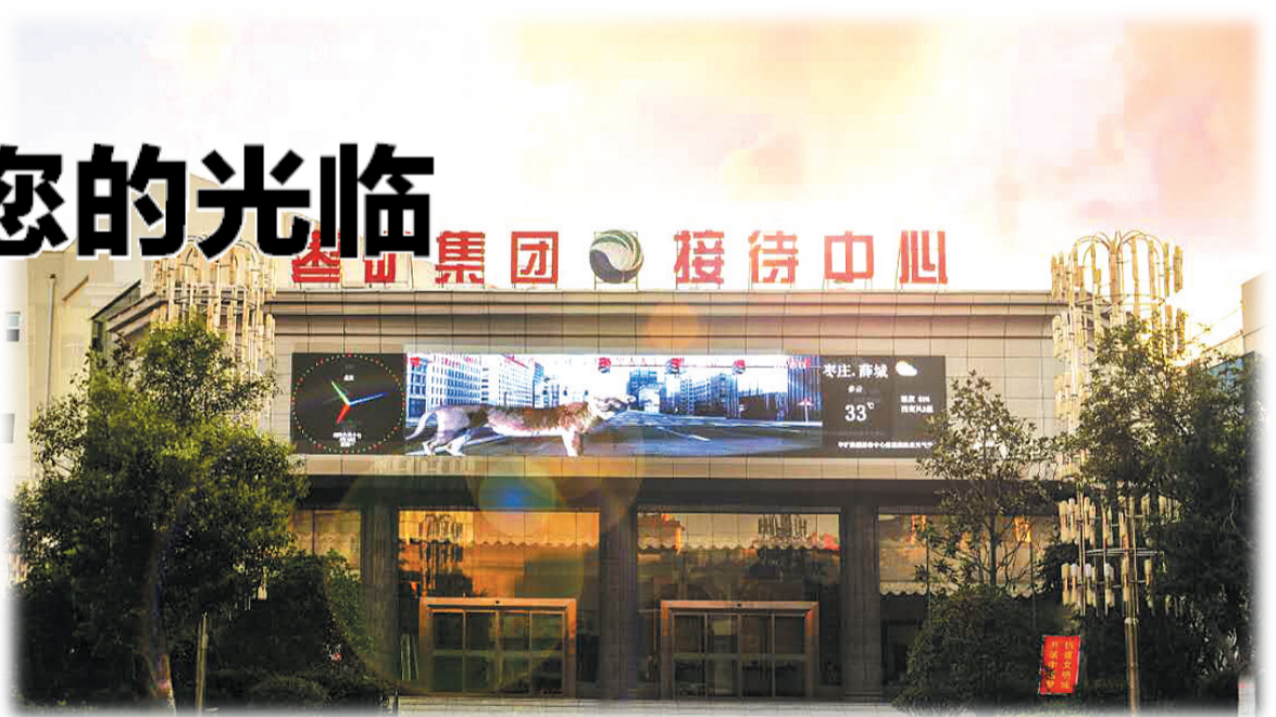
枣矿集团接待中心外景

酒店不但致力于打造“钻石”级闪耀的服务品质,更加重视营造一支“钻石”级闪耀的服务团队。开业至今,枣矿集团接待中心始终坚持以人为本,把全员培训放到一个战略性的角度上,结合自身条件,组织开展了形式多样的培训,也对管理人员的素质提出了更高的要求。酒店定期组织管理人员观看、学习有关企业管理、执行力、成功学等教学资料,专门聘请专家对管理人员进行培训,并多次组织管理层赴济南、杭州、淄博、吉林等地进行考察学习。这一切都为