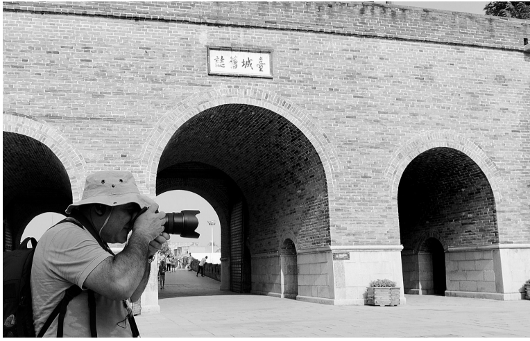
摄影师在古城内拍摄。