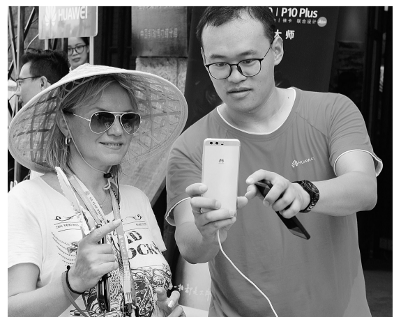
市民争相与摄影师合影。