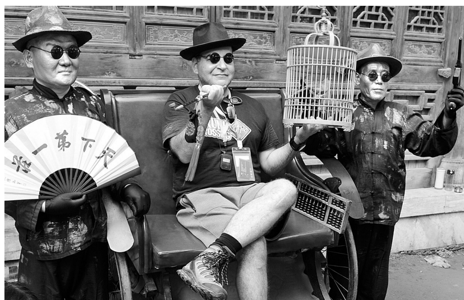
“歪果仁”也能穿出中国味儿。