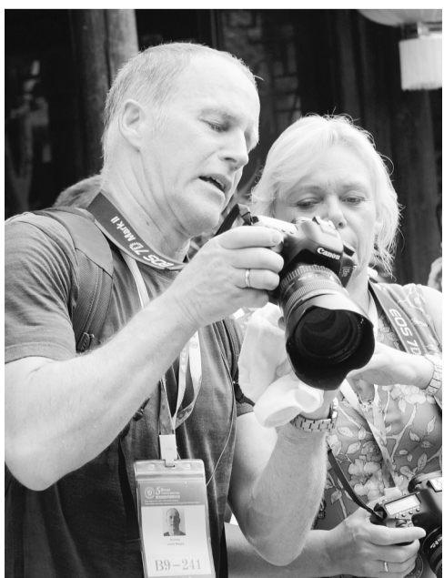
“这个角度比较好，你看看。”