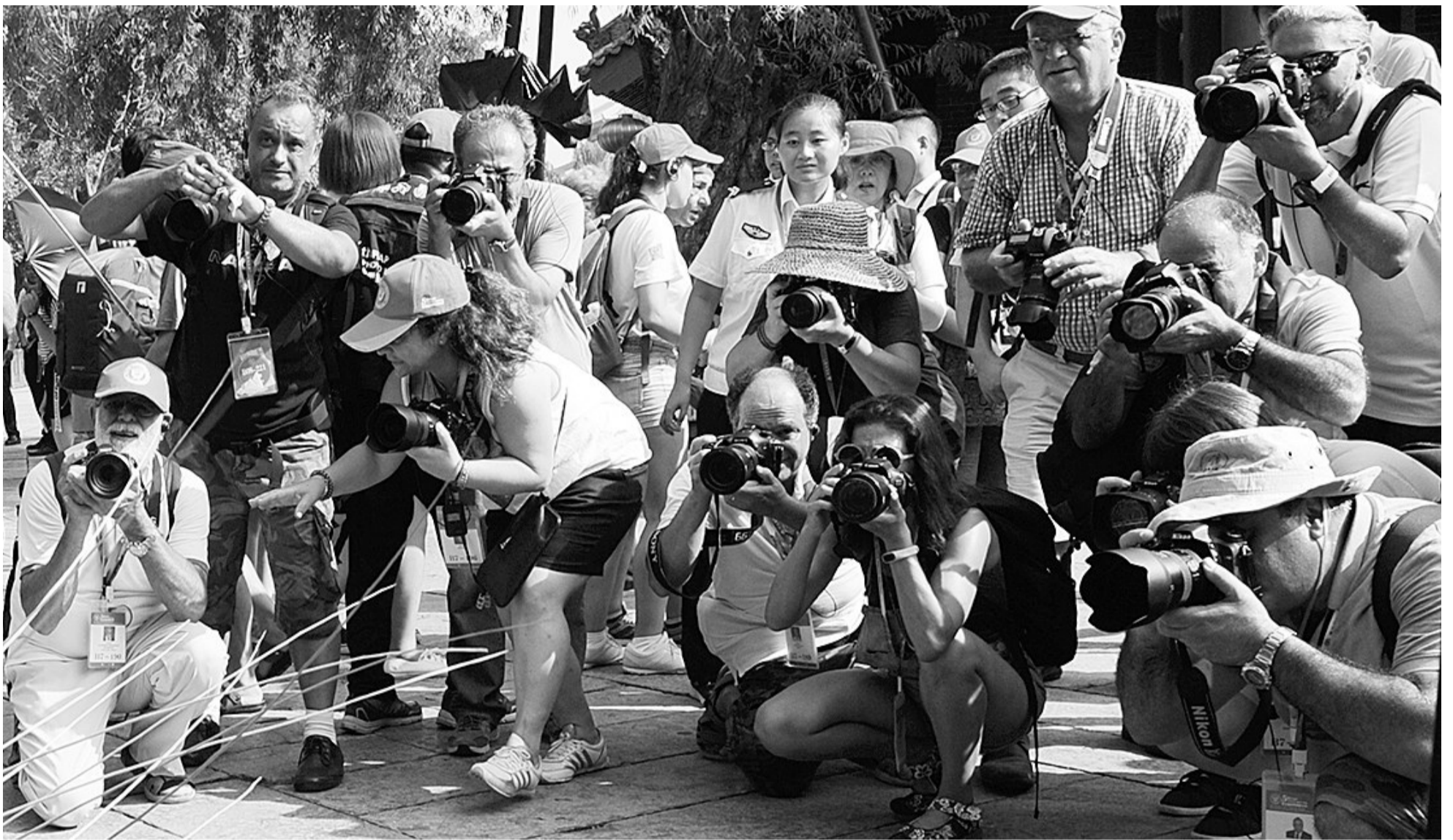
捕捉古城优美的瞬间。

世界摄影大会被誉为“全球摄影界的奥林匹克”，每两年一次，已先后在意大利、希腊、印尼和古巴成功举办四届，成为展示区域文化特色、促进国际文明交流的重要载体。世界摄影大会首次“落户”中国，并于8月7日在济南举行了第五届世界摄影大会开幕仪式。山东省是此次大会的主办方，枣庄是承办城市之一。8月10日至11日，与会的140余名摄影师来到美丽的台儿庄古城，用影像语言记录下古城的自然和人文之美。这次采风活动为提升我市的国际影响力，让世界了解枣庄，了解台儿庄古城，加强我市对外交流提供了千载难逢的历史机遇，并向全世界展示了绚烂的运河文化。