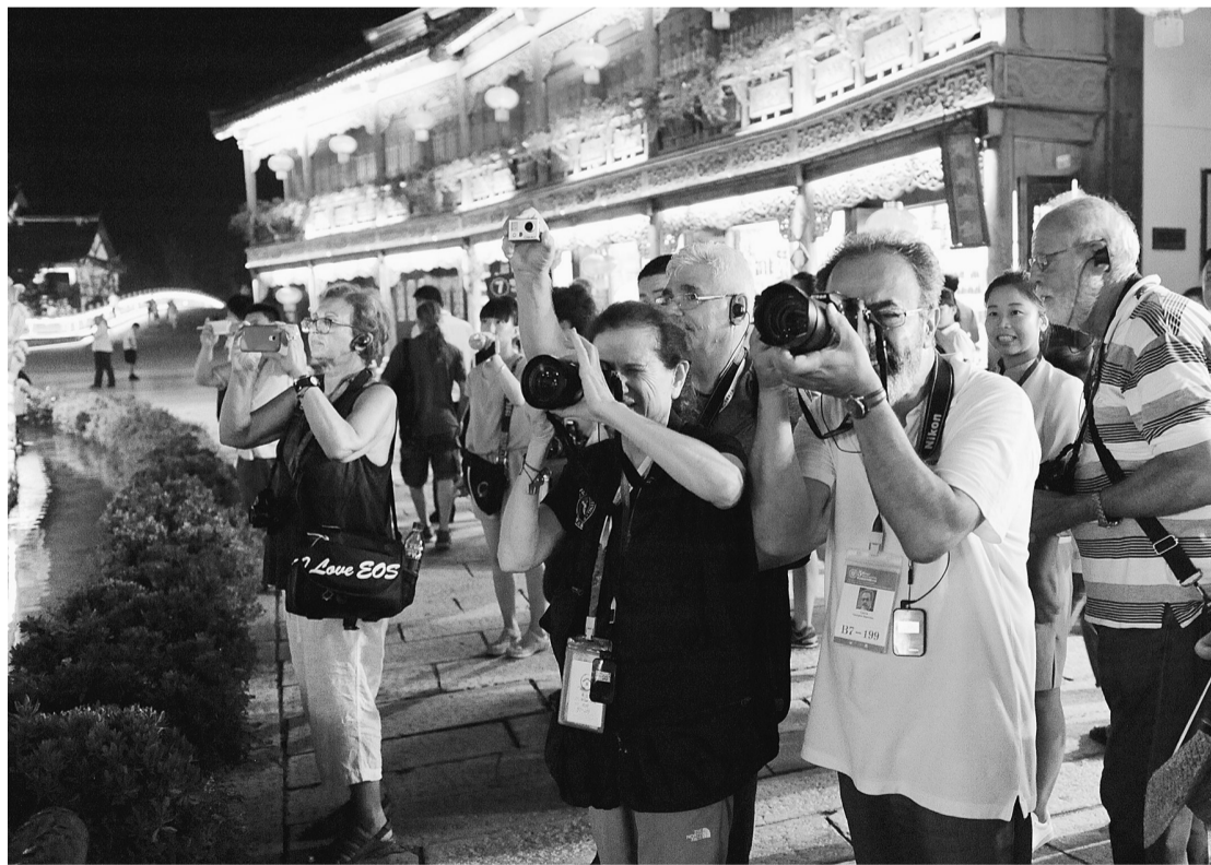
拍摄美丽的古城夜景。