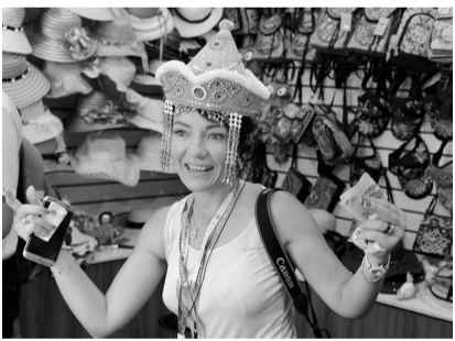
“这顶帽子很适合我吧？”

世界摄影大会被誉为“全球摄影界的奥林匹克”，每两年一次，已先后在意大利、希腊、印尼和古巴成功举办四届，成为展示区域文化特色、促进国际文明交流的重要载体。世界摄影大会首次“落户”中国，并于8月7日在济南举行了第五届世界摄影大会开幕仪式。山东省是此次大会的主办方，枣庄是承办城市之一。8月10日至11日，与会的140余名摄影师来到美丽的台儿庄古城，用影像语言记录下古城的自然和人文之美。这次采风活动为提升我市的国际影响力，让世界了解枣庄，了解台儿庄古城，加强我市对外交流提供了千载难逢的历史机遇，并向全世界展示了绚烂的运河文化。