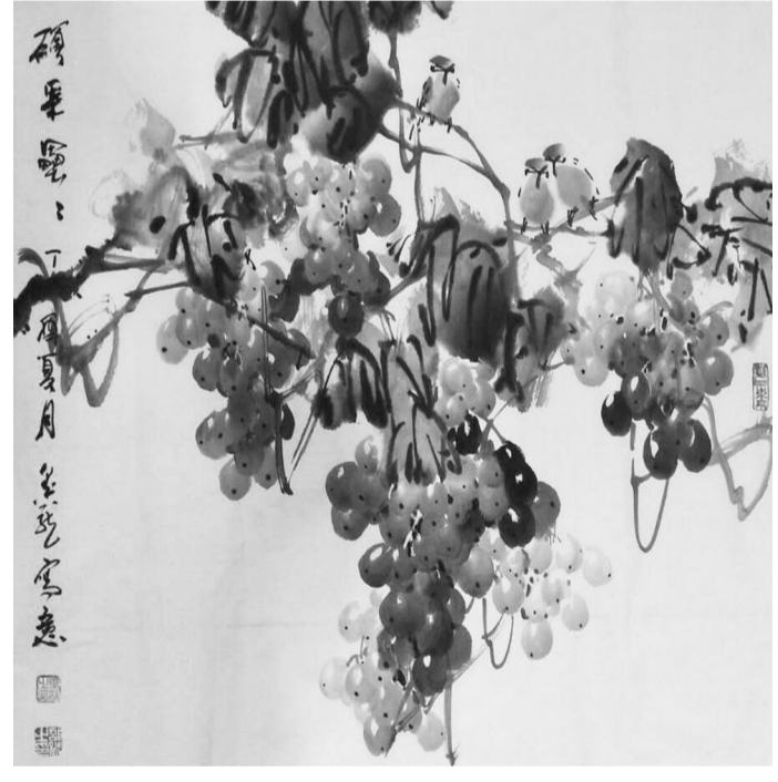
硕果累累 (国画) 邵斌作