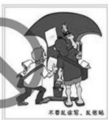
不要乱涂写、乱张贴