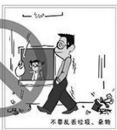
不要乱丢垃圾、杂物