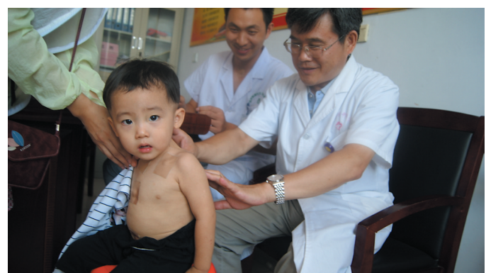
7月12日上午8点,台儿庄区中医医院举行“治未病—冬病夏治”大型健康科普活动,现场开展了健康讲座,并为群众发放体验卡以及免费穴位贴敷等。

滕州讯 为更好地做好传染病防治工作,近日,北辛社区卫生服务中心对医务人员进行了感染病防治的相关知识培训。此次培训以传染病防治法及突发公共卫生应急条例等为主要内容,采取幻灯片教学形式,图文并茂满足了医务人员的学习需要,确保了培训实效。此次培训的开展,提高了医务人员的传染病专业知识、传染病监测及网络直报素质、突发公共卫生事件相关知识,以及医务人员对传染病防治重要性和紧迫性的认识,提高医疗服务质量。(杨通)