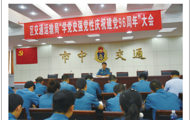
为庆祝中国共产党成立96周年,深入推进“两学一做”学习教育,凝聚党员力量,振奋党员精神。7月1日下午,区交通运输局组织全体党员干部召开了“学党史强党性庆祝建党96周年”大会。

通过学习,各参训人员掌握了这项工作的内容,为扎实的开展好我区残疾人精准康复服务工作打下了坚实的基础。