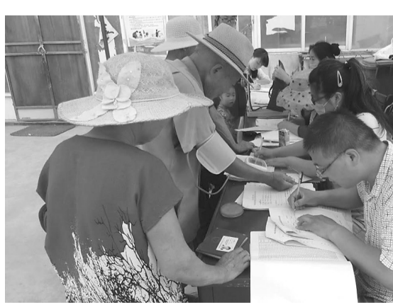
6月16日,枣庄市九三学社部分社员与市中区人民医院儿科专家,来到特教中心,为60余名儿童做健康体检,给孩子们送去了浓浓的关爱与温暖。