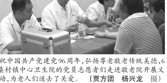
为庆祝中国共产党建党96周年,弘扬尊老敬老传统美德,6月28日,桑村镇中心卫生院的党员志愿者们走进敬老院开展义诊服务活动,为老人们送去了关爱。

6月28日上午,市中区卫计局组织疾控中心专家走进十六中(北校),开展“关注校园内的癫痫患者——2017国际癫痫关爱日”活动。