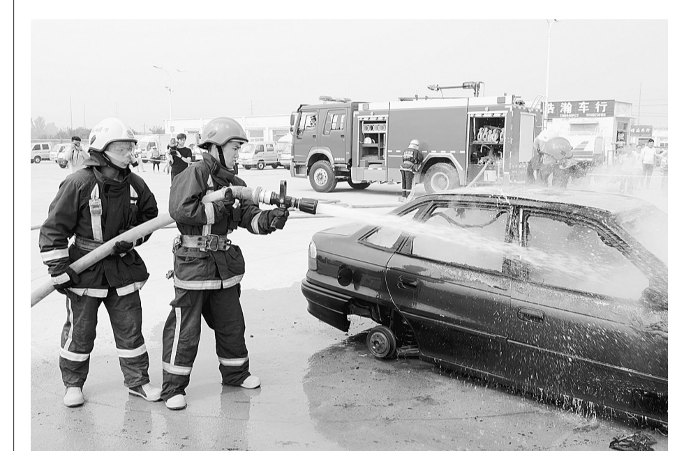
夏季消防应急演练

本报讯 6月30日上午,全市化工产业安全生产转型升级培训会在新城会展中心召开。副市长、市化工产业安全生产转型升级专项行动领导小组副组长张成伟出席并讲话。