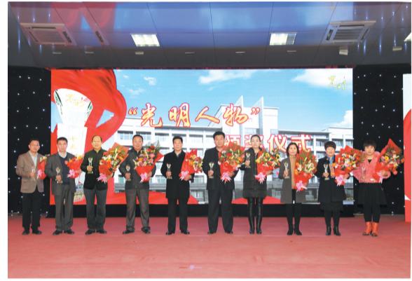
首届光明十大人物合影