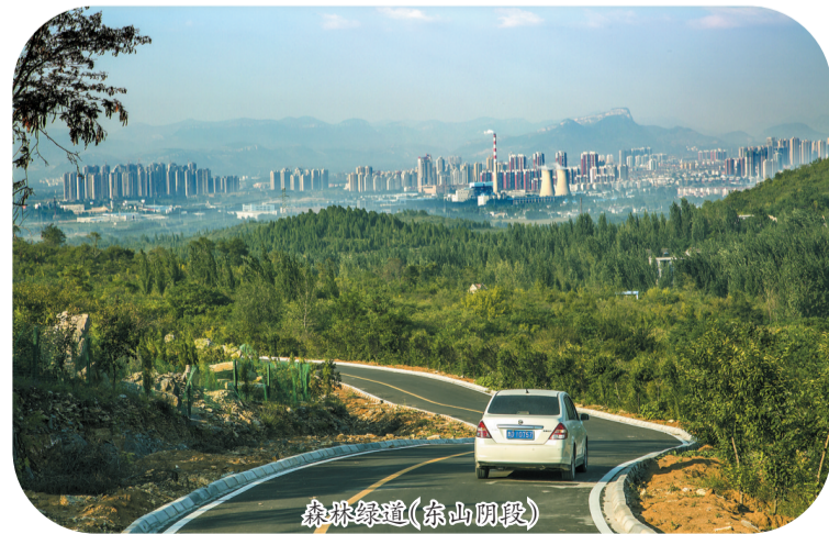
森林绿道(东山阴段)