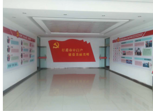
光明路街道党群服务中心