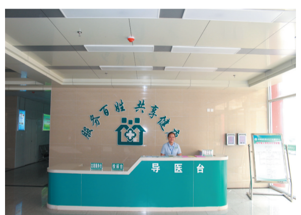
光明路街道社区卫生服务中心