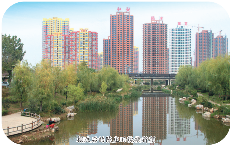
棚改后的陈庄面貌换新颜