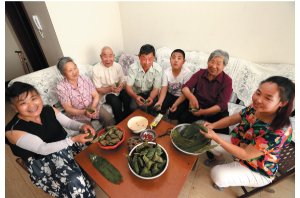
雷村新乡贤全家福