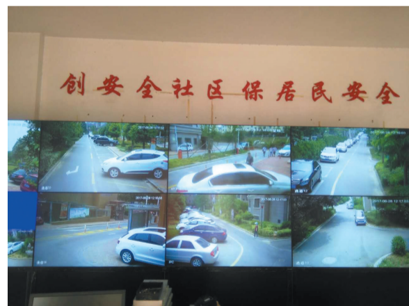
东盛社区电子监控全覆盖