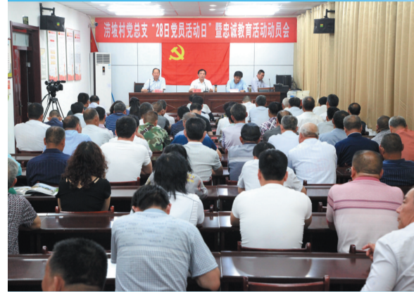
开展28日党员活动日暨忠诚教育活动