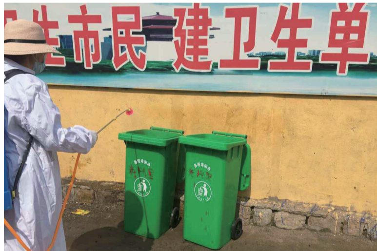
连日来,我区再掀“两城”同创新高潮,相关镇街、区直部门纷纷投入到创城工作中。(本报通讯员综合报道)