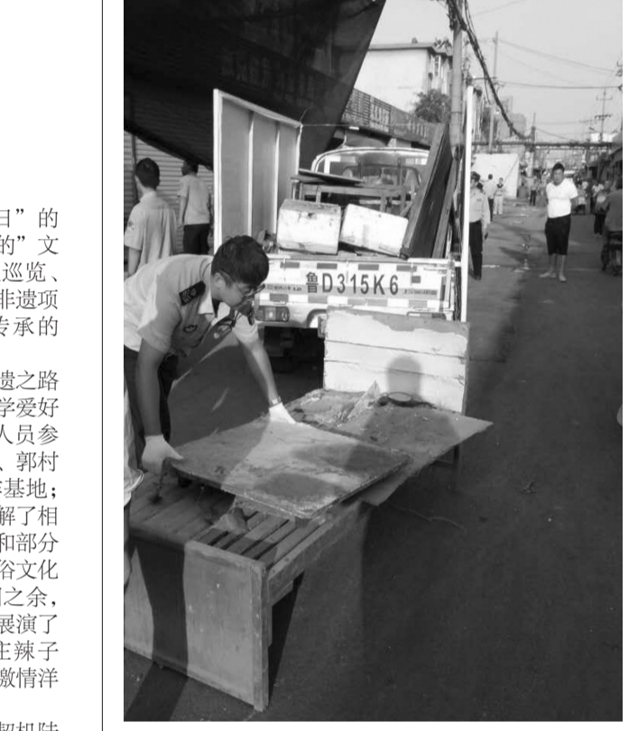
6月5日,文化路街道组织50余人对建华市场进行专项清理整治。经过前期宣传说服,整治工作得到了市场商户和周围居民的大力支持和肯定,大多数商户在执法人员的协助下纷纷自行拆除、整顿。

齐村讯 为迎接第11个“非遗日”的到来,齐村镇文化站联合辖区“中的”文学、艺术社通过邀请社会文化名人巡览、开展讲座、组织部分群众参观辖区非遗项目等活动,提升“非遗”保护传承的意识。