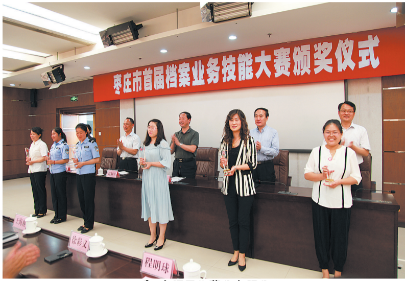
省、市领导为获奖者颁奖

今年6·9国际档案日的主题是:档案,我们共同的记忆。档案是人类文明发展和进步的“传家宝”。习近平总书记指出,“档案工作是一项非常重要的工作,经验得以总结,规律得以认识,历史得以延续,各项事业的发展,都离不开档案和档案工作”。新的时代赋予档案工作新的发展机遇,市档案局将继续带领各区市档案局、专业档案馆,指导、协助各单位档案工作,积极作为、扎实工作,干在当前、成在实处,推动我市档案事业科学发展、创新发展,为建设自然生态宜居宜业新枣庄做出新的更大贡献。