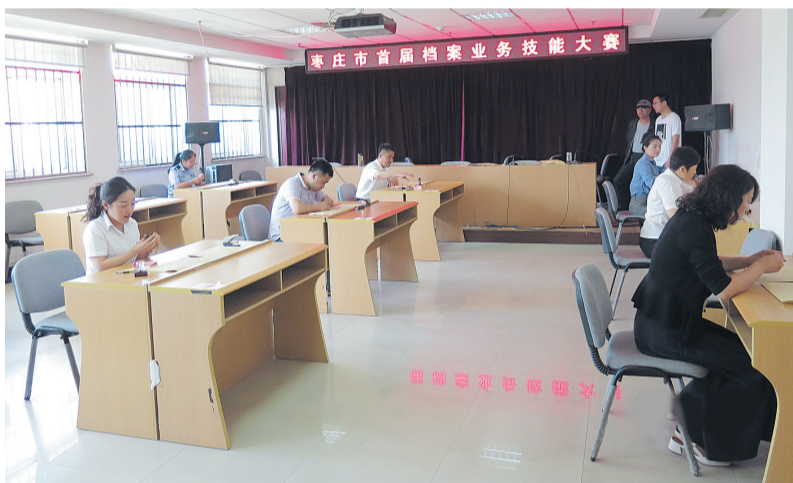
选手们的操作一丝不苟