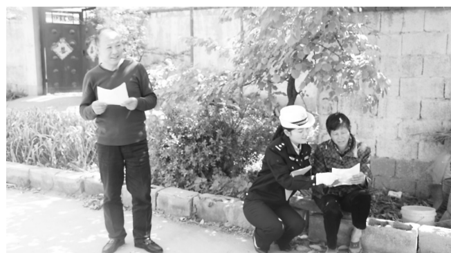
近日,峰城交警大队民警走进农村以发宣传单、摆放展板、面对面宣传提示的方式,向群众进行交通安全知识和道路法律法规普及和宣传。