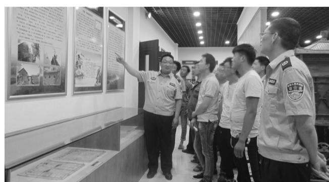
近日,羊庄司法所组织社区服刑人员到滕州老县衙参观了传统文化教育基地,到孔子学堂听取了《弟子规》、《道德经》专题讲座,到羊庄镇敬老院、老年公寓、农村幸福院进行了公益劳动。