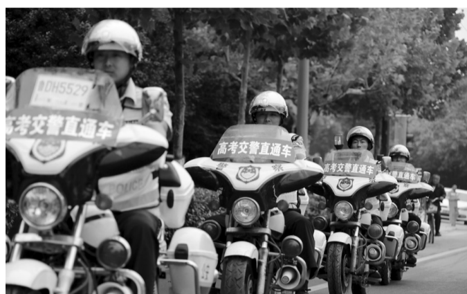
高考期间,市中交警大队启动了高考保障措施预案,组织民警成立了高考执勤队、巡逻队、服务队、应急队等,为考生营造良好的安全考试环境。