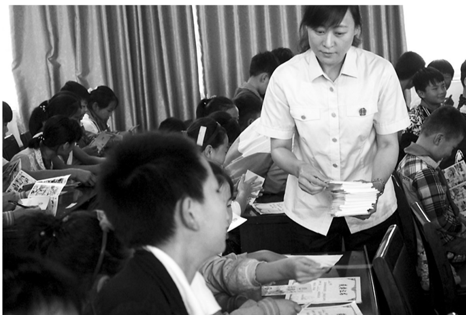
近日,市中级人民法院开展“法佑青春——法治教育进校园”活动。该院选取部分青少年犯罪典型案例专门印制了《法律读本》,并分别送往多所中小学及中职院校,教育引导未成年人用法律保护自己。