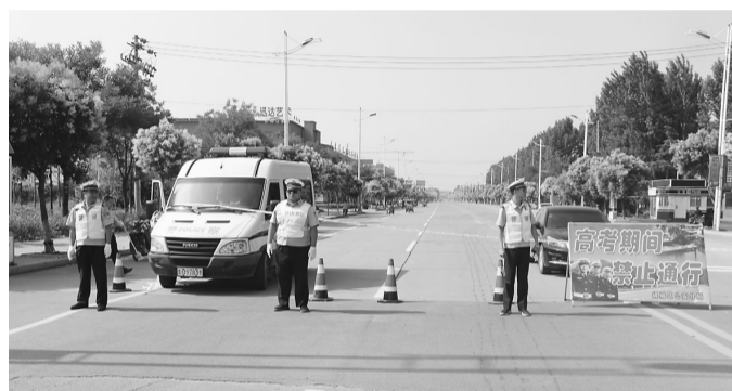
6月7日,峰城交警大队总结经验,全警上路,在考点大门口和通往考点附近道路安排专人负责交通疏导,落实禁行、禁鸣、禁停等交通标识。确保考生进出考点时的道路畅通。