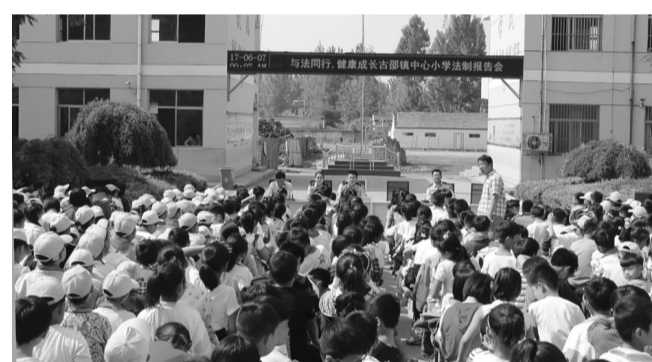
6月7日,古邵司法所联合古邵镇教委组织法制副校长在古邵镇中心小学开展“与法同行·健康成长”为主题的法制讲座。