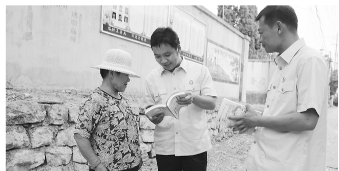
5月31日,市中级人民法院法官走进薛城区沙沟镇城子村宣讲法律知识、发放法律书籍、提供法律咨询。

工地夜间施工、商铺摊贩发出高噪声招揽顾客、公共场所组织娱乐活动导致噪声扰民。畅通举报处置渠道,建立应急处置预案。对外公布举报电话,快速反应,及时处理。同时,明确考点周边保障任务,责任中队及具体责任人,及时制止可能出现的各类干扰考试的问题。(通讯员 李卫卫)