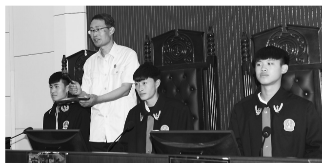
6月5日,山亭区职业中专的师生们到山亭区法院开展少年法庭开放日活动。