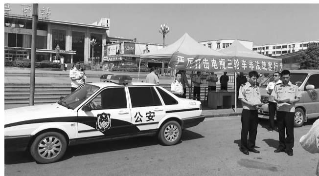
近日,薛城区城管局联合交警、交通等部门集中开展枣庄西站及周边环境综合整治行动。

高思想认识,切实增强推进“两学一做”学习教育常态化制度化的思想行动自觉。二是坚持常抓不懈,全面落实“两学一做”学习教育常态化制度化各项任务。三是强化组织领导,确保“两学一做”学习教育常态化制度化扎实有效。(通讯员 张雷 赵月雷)