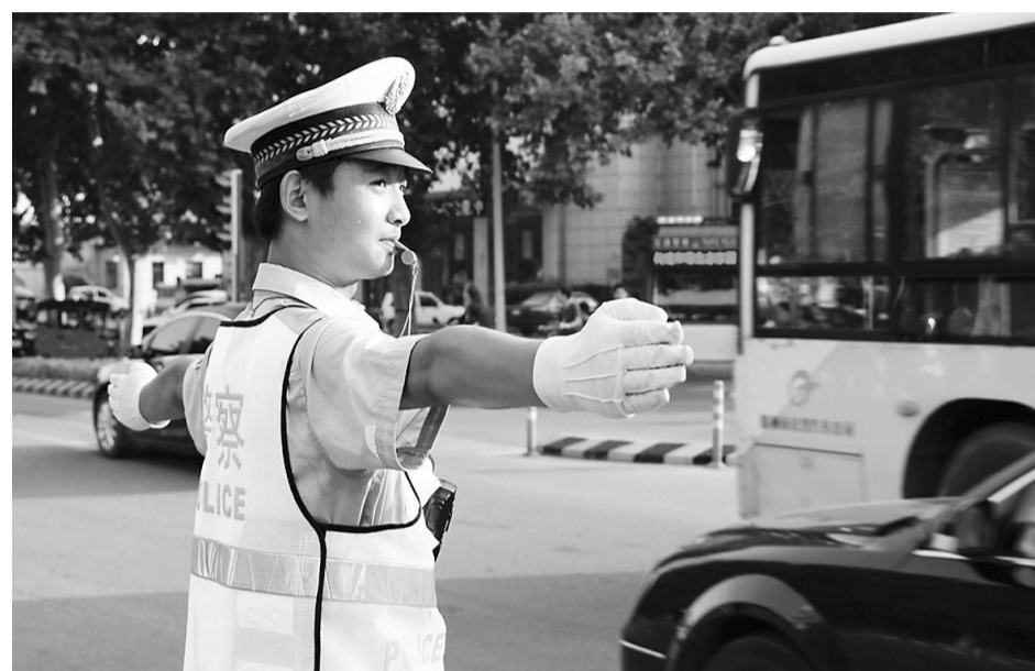
5月7日上午7时许,市交巡警支队派出大量警力,投放到各个考点帮助执勤,指挥交通,发放宣传资料,服务高考。