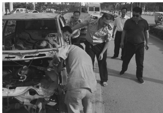
“双创”活动开展以来,市中区城管局执法人员连续奋战一线,全区共拆除违法建设1150处,面积134668平方米。