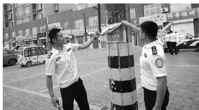
连日来,峰城区城管局开展“祛斑除癣”整治行动,及时清除“野广告”,助力峰城区“双创”工作。