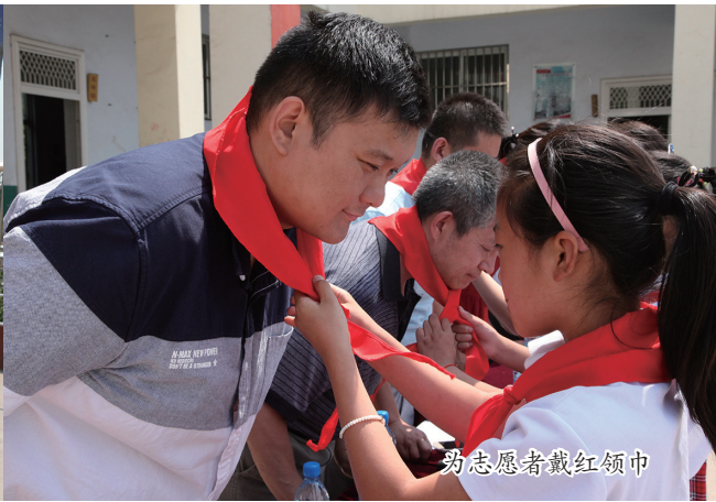
为志愿者戴红领巾