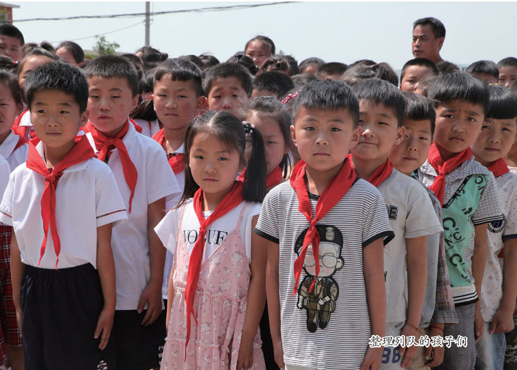
整理列队的孩子们