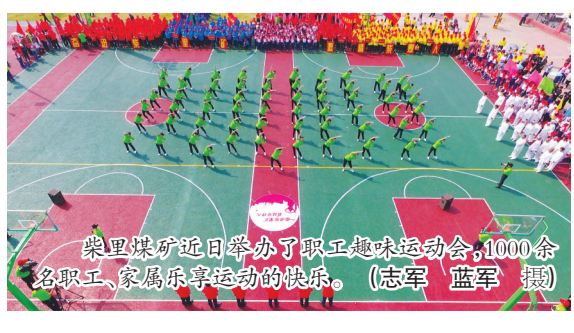
梁里煤矿近日举办了职工趣味运动会，1000余名职工、家属乐享运动的快乐。

本报讯 滨湖煤矿按照“机械化换人、自动化减人”的要求，在大力实施薄煤层采煤自动化的基础上，在掘进专业装备和工艺升级上做了文章，着力打造集成高效掘进工作面。 他们在16111材料巷掘进工作面创新应用了皮带集控装置，实现了运输系统的远程智能化控制。该系统由监视和操作两个系统组成，在卸载点等重点部位均安装了高清摄像头，实时监控皮带运行状态，具有自动化程度高、安全性能好、实用性强、运行可靠等优点。 皮带集控装置的成功应用还推动了基层区队劳动组织的优化。掘进二区技术员杨建伟介绍，通过装备升级，皮带运输系统每班可减少2个岗位工，他们把富余人员充实到后路底板治理、钉道等人员紧张的岗位中去，劳动组织更加合理，有效提高了工作效率。 据悉，掘进二区目前每班可完成进尺5.2米，相比以前提高1.3米。4月份，他们还创出了进尺400余米的历史最好成绩，有力缓解了矿井生产接续压力。 (胜奎)