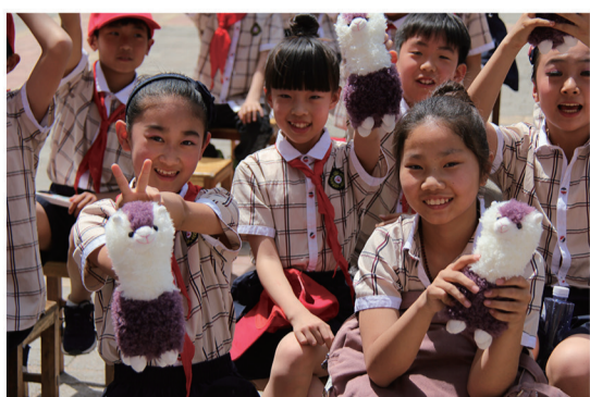
学生们领到爱心企业捐赠的玩具高兴极了

读书学习是青少年成长的必由之路,是教师专业发展之基。匡衡凿壁偷光的故事家喻户晓,激励着一代又一代人读书成长。优良的读书传统,应该在我们这一代继承与发扬!