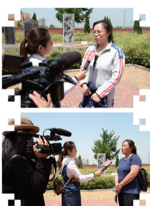
现场采访学生家长