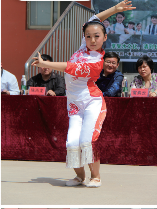
节目表演精彩纷呈