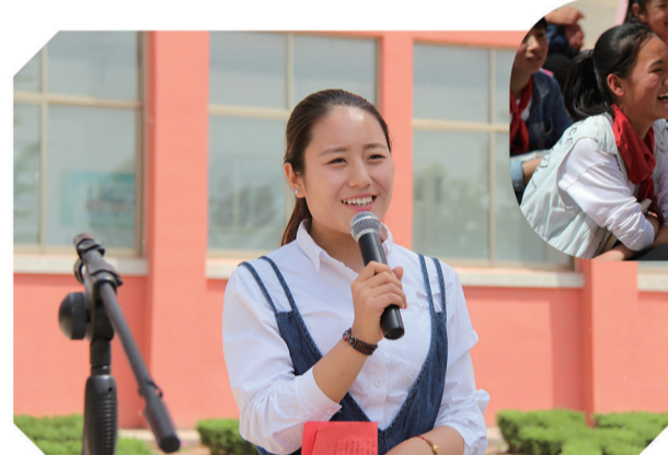
主持现场 精彩互动

摄影报道 记者 马国亮 陈君田 孙彪文 李晓晴 特约记者 杨维 李洋洋 策划统筹 宋廷江 张作华 尹泉 陈静 李莉 付瑞茂