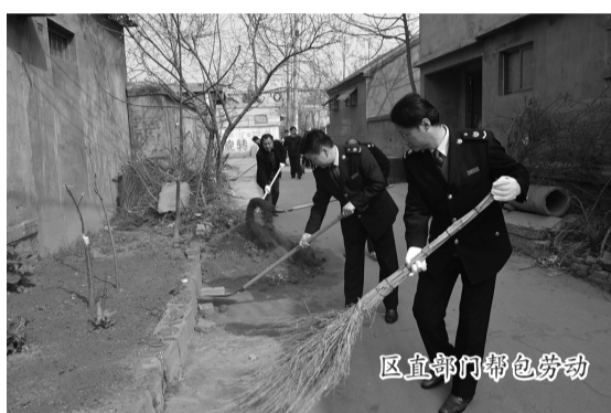
区直部门帮包劳动