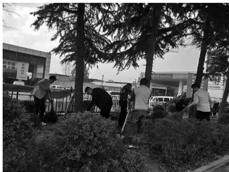
组织机关人员打扫卫生