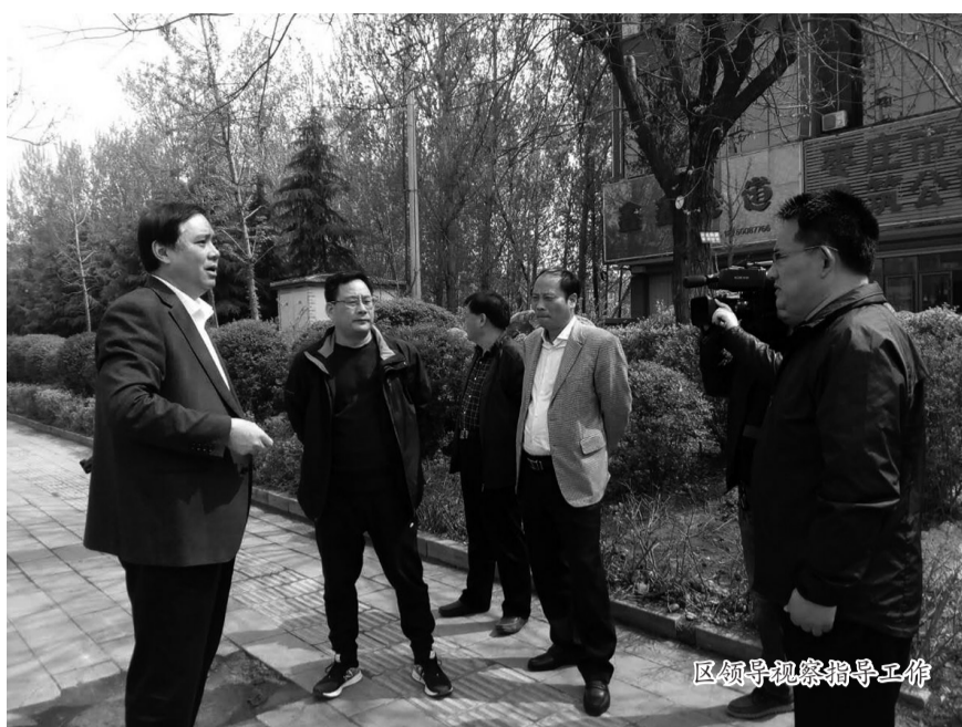
区领导视察指导工作