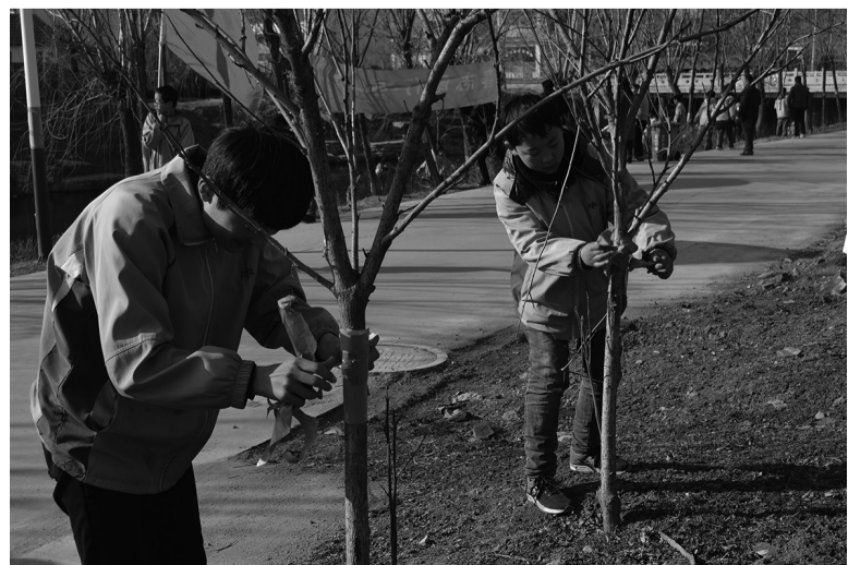
青年志愿者开展爱护环境活动