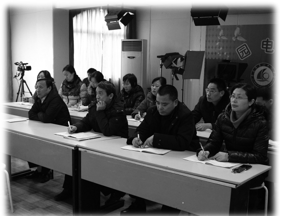
校领导与老师们在校因电视台听课