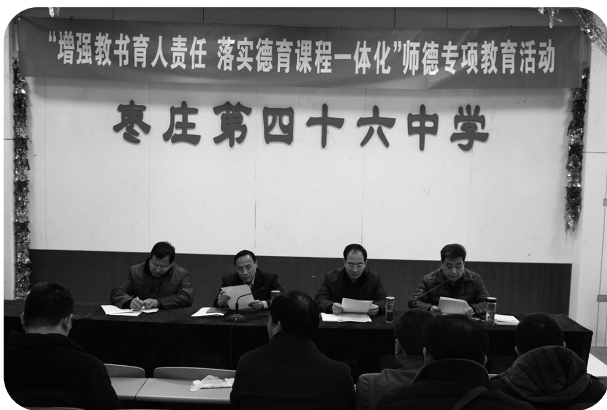
学校进行师德教育