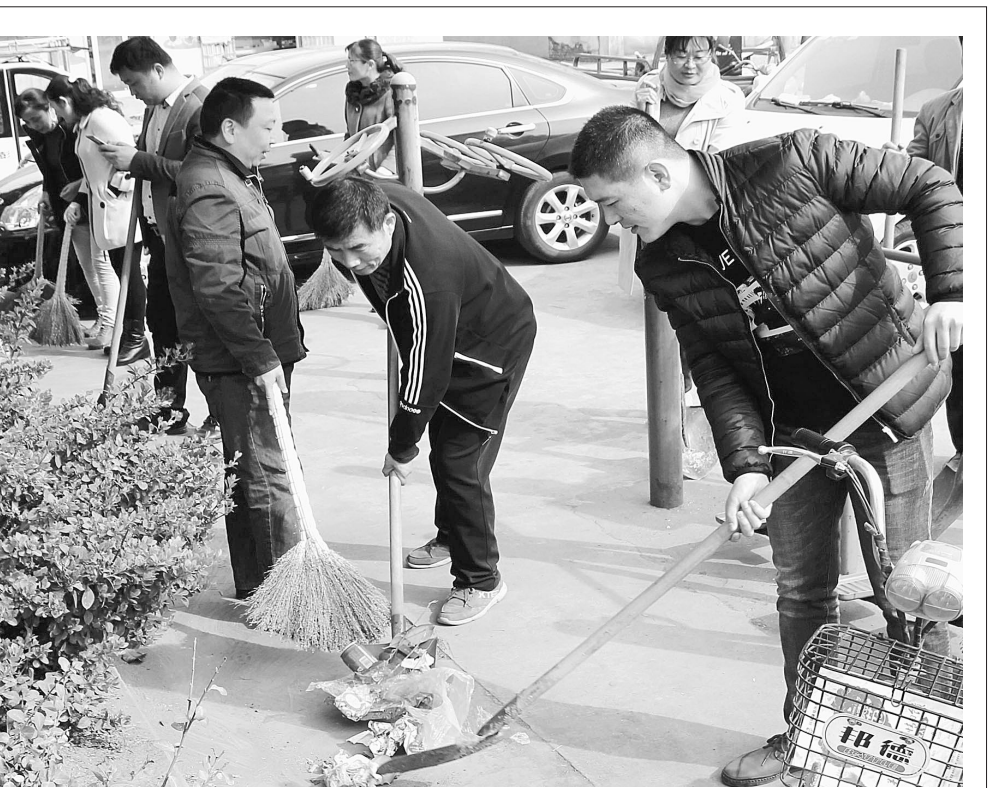
人人参与 美化市容 近期,薛城区陶庄镇组织机关党员干部开展社区存量垃圾清理活动,彻底清除卫生死角,带动居民人人参与环境卫生管理,提升城乡环卫一体化水平。

就贯彻落实好会议精神、进一步做好我市创建省级文明城市工作,李峰提出三点要求:一要注重统筹结合抓创建。各级各部门要按照“一创六建”的思路,以创建省级文明城市和未来创建全国文明城市为总抓手,同步推进国家卫生城市、国家生态园林城市、省级生态市创建,同步提升国家森林城