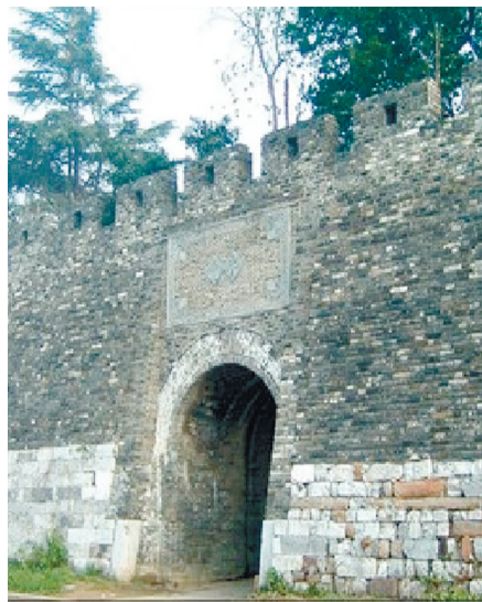
明清时期老滕县城墙